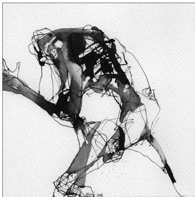
Damó István: Az Úr haragosai, avagy az el nem hangzott párbeszéd (2016, tusrajz, papír, 13x13 cm)