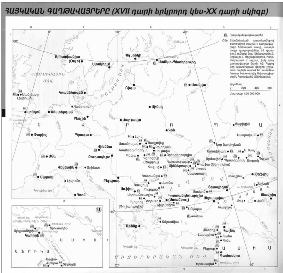
Örmény kolóniák a XVII-XX. században

Az örmény történelem első nagy csoportmozgásai már az ókor idején megindultak, amikor egyes uralkodók városok, vagy területek egész lakosságát telepítették más helyre. Érdekes, hogy ez az áttelepítés a kereszténység felvételéig (Kr. u. IV. sz. eleje) nem eredményezett kolóniákat. Itt kell kiemelni, hogy a IV. századtól az örmény apostoli egyházban, és az örmény írásbeliségben ( Haj Arakelakan Jekegheci, Mastoci hajkakan ajbuben ) megtestesült nemzeti önzonosság és az összetartozás megtartó erőnek bizonyult nemcsak a nemzet történelmében, hanem a kolóniák létrejöttében és fennmaradásában is.