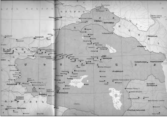
Arménia és a kereskedőutak

tő programot folytatta az ifjútörök kormány is, mely 1915-től végrehajtotta a XX. század első népirtását. Ennek másfél millió polgári lakos esett áldozatul, félmillió pedig más országokban keresett és talált menedéket.