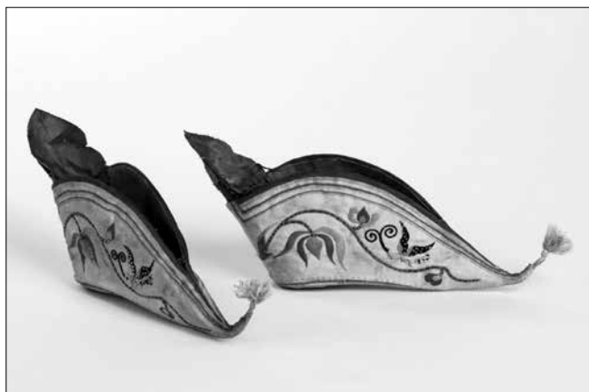
Kínai női lótuszcipellő (19. század második fele)