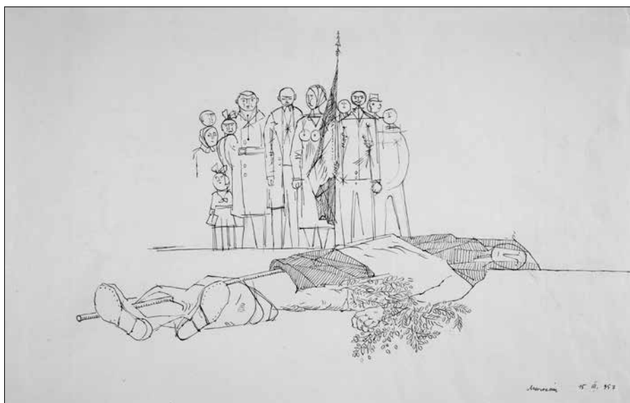
Marosán Gyula: Az első halott (1957) tus, tollrajz (Forrás: MNM Történeti Tár