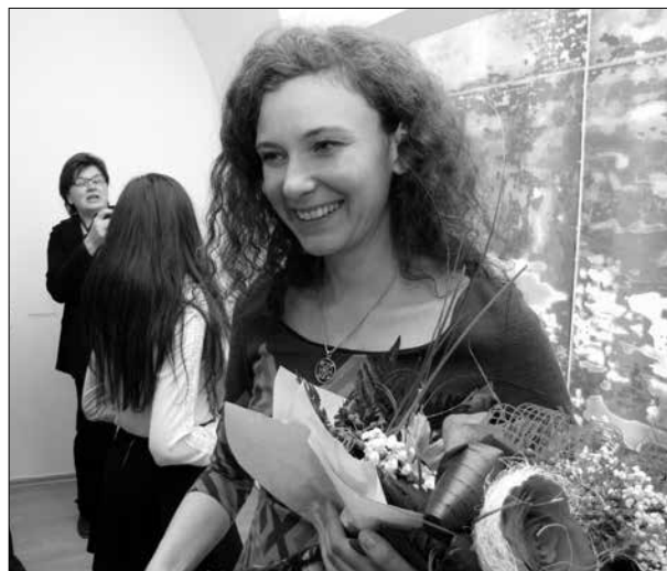
A pozsonyi kiállítás megnyitója után