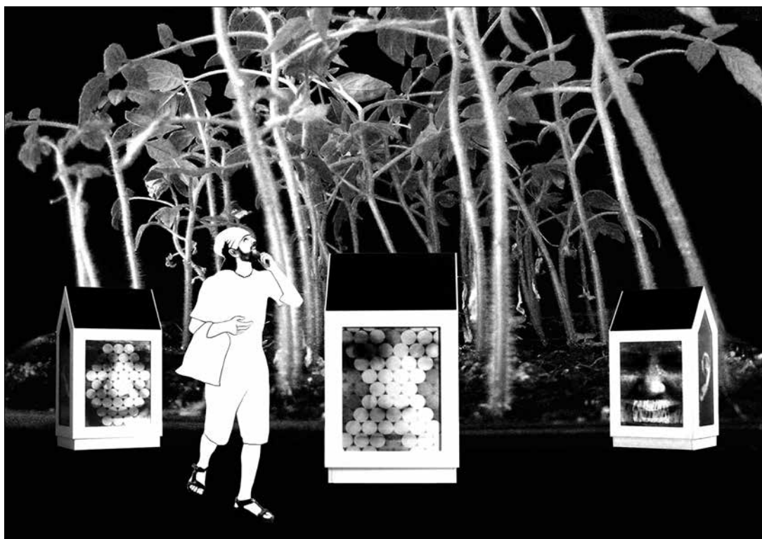
„És odaadta neki Paradicsomot házává” 2012, fényvisszaverő reflex fólia, jelzőtábla, 76x105 cm