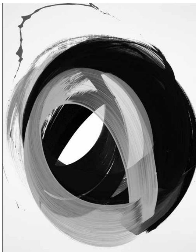
Nádler István: Nulla-ciklus No.1. (2014, akril, kazein-tempera, papír)