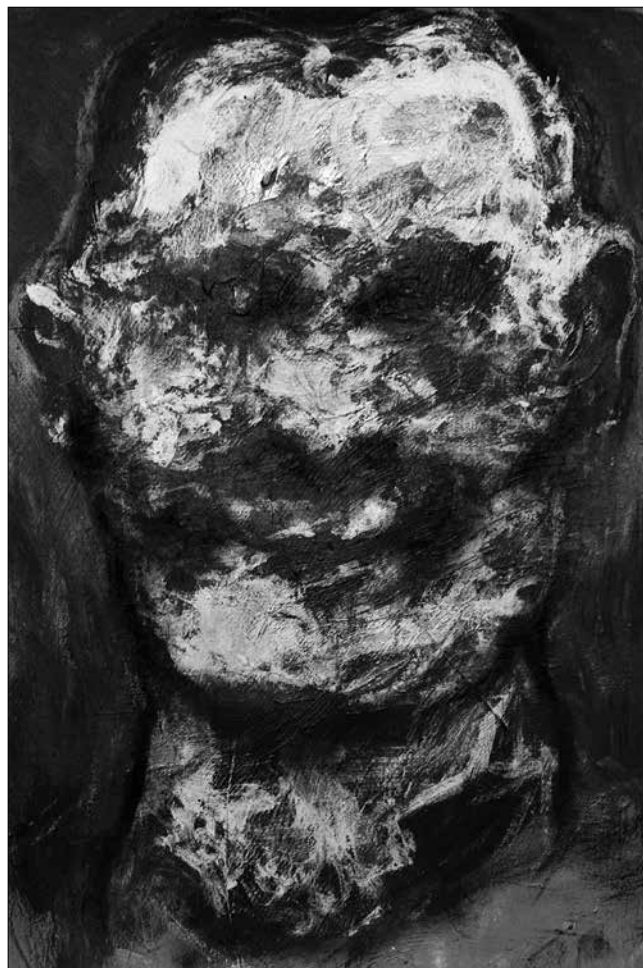
Gaál József: Fej I. (2014, vegyes technika, papír)