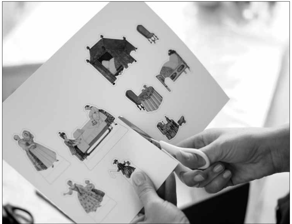
Képkivágás a kísérő gyermekprogramokon

többször koncertezett a városban, a helyi előkelőségek otthonában. A tágas főtéri lakás zeneterméről készült kép ezért is izgalmas. Abroncs-szoknyás hölgyek legyezik magukat rajta, tapsolnak vagy virágcsokrot nyújtanak át a rizsposros parókás muzsikusoknak. A fehér szalon falán tájképek és az elődök képmásai, a tálalón ezüst és fajansz díszedények, egy asztalkán madárkalitka áll. Az oldalajtón át a hálófülkébe látni, ahol a kitárt, kétszárnyú ruhászekrény polcain glédában áll a frissen mosott-vasalt fehérnemű. Ezek a cselédszobában szorgoskodó, „pihenésként” rokkán fonogató vagy foltozó, varrogató szolgálók kezéből kerültek ki, miközben a nagypolgári család nőtagjai az ebédlőben a csemegékkal rakott asztal körül uzsonnáznak, vagy más szobákban hímeznek, harisnyát kötnek, csipkét vernek, avagy a társaságban táblajátékot játszanak. Az említett helyszíneken és jeleneteken túl, betekintést kaphatunk a vaslábasokkal, rézserpenyőkkel és óntálakkal alaposan felszerelt konyhába éppúgy, mint a halat, vadat, zöldséget, gyümölcsöt és egyéb élelmiszertartalekokat őrző kamrába, de kitekintést nyerünk a lépcsőházba is, a küszöbön fekvő ház-őrző kutyákra... Ezzel azonban korántsem teljes a felsorolás.