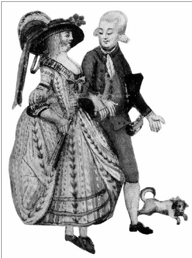
Elegáns sétáló pár kutyával a téren