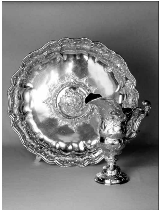
Augsburgi aranyozott ezüst mosdókészlet (1763/64)