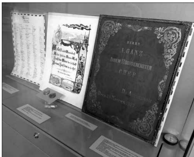
A 100 000. vasúti kerék öntése alkalmából rendezett ünnepségre készítették Ganznak a munkások ezt a díszalbumot. Mellette a munkások aláírásai láthatók, valamint ezüstpénzek, melyeket Ganz ajándékozott munkásainak.

Ganz, a humanista kapitalista – Ganz, az ember