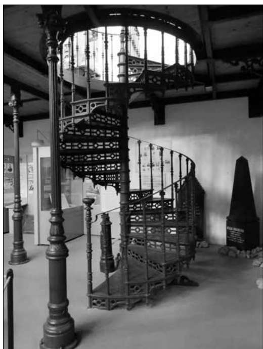
A Ganz-öntödében készült öntöttvas lépcső ma az Öntödei Múzeumban látható

Az átépített csarnok belülről. Jól látható az eredeti fa tetőszerkezet a sédtetővel. Ez utóbbi az ország első ilyen jellegű tetője volt.