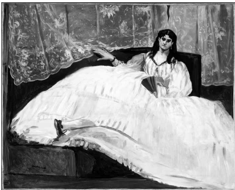
Edouard Manet: Hölgy legyezővel (1862)