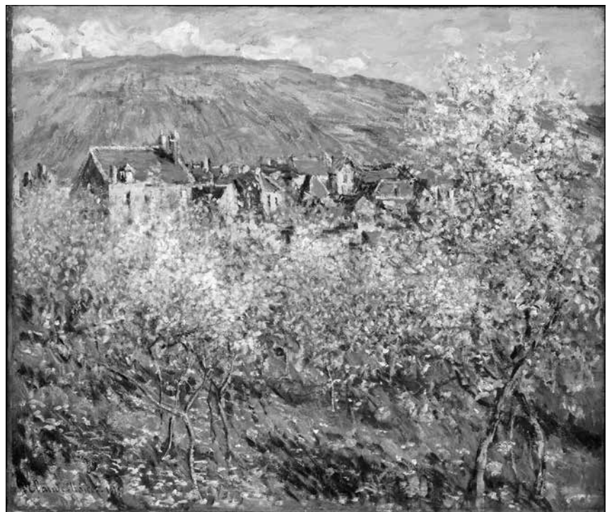
Claude Monet: Virágzó szilvafák (1879)