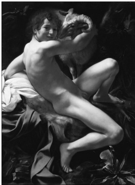
Caravaggio: Keresztelő Szent János (1602)