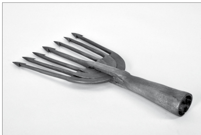
Halász szigony kovácsoltvasból