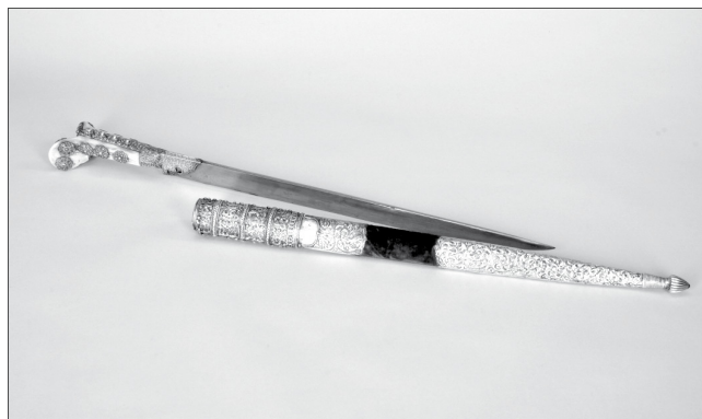
Csontnyelű jatagán filigrán ezüst tokkal

A XIX. század második felében a Fiume, illetve Abbázia (Opatija) felé kiépült vasútvonalak miatt