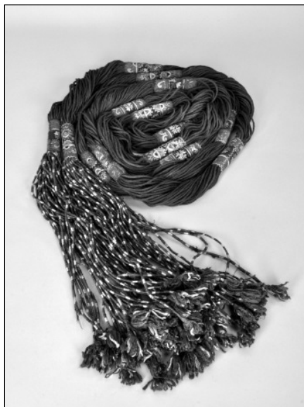
Italtároló kobaktök karcolt és festett díszítéssel Többszörösen körbetekerhető férfi deréköv Hímzett női fejkendő részlete