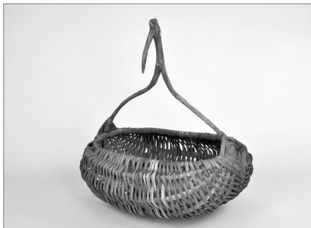
Vesszőből font kosár gyümölcsszedéshez