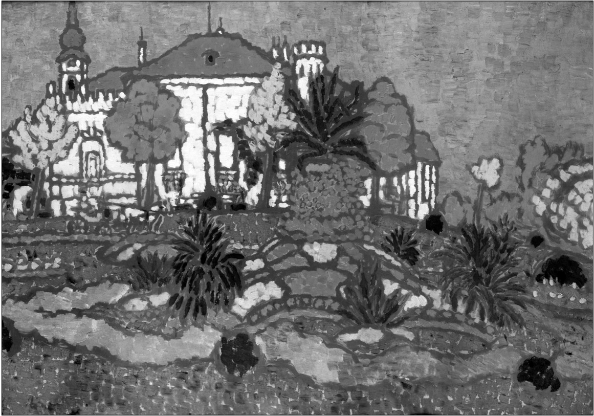
Rippl-Rónai József: A Geszti kastély Somogyban

boldala (1891-1895 kör.) Szinyei Merse Páltól a Virágzó mandulák (1902). 1890-ben festette olajjal lenvászonra nyárfasorát Claude Pissarro „Naplemente Éragynánál” című képén a dombos lanka alján, illetve Mednyánszky a vízparton, a „Hóolvadás hegyvidéken” című alkotásán.