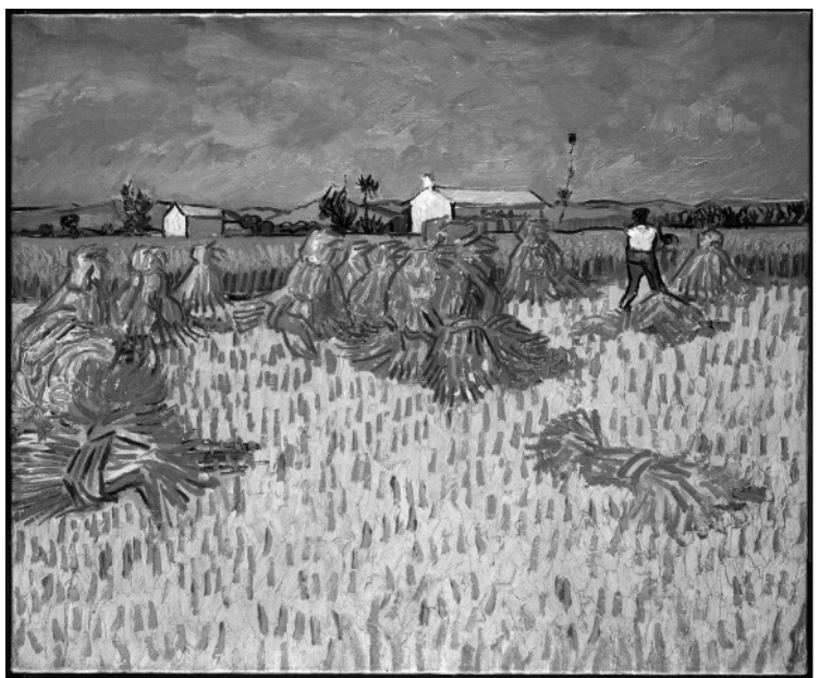
Vincent van Gogh: Provence-i aratás, június (1888)