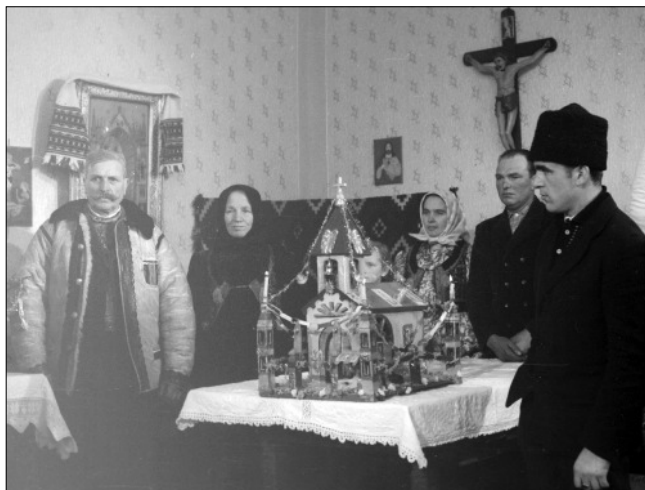
Betlehemezés Kakasdon 1965-ben a bukovinai székelyeknél