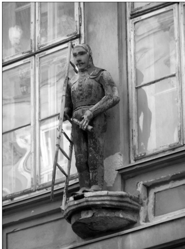
A kissé kopott kéményseprő figura a Bródy Sándor u. 15. sz. alatti ház homlokzatán áll.