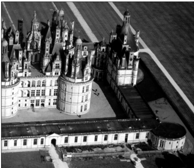
A francia Chambord-kastély