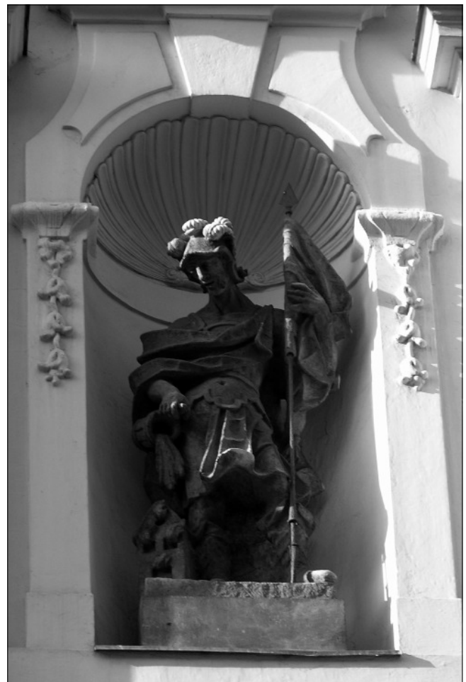
Szent Flórián a Fő utcai Szt. Flórián templom homlokzatán

A korábbi századokban nemcsak a városok, templomok, kolostorok választottak maguknak védőszentet, hanem a céhek is. A patrónusoktól a nehézségek elhárítását és védelmet reméltek, másrészt közbenjárást az Úrnál. Így volt ez a kéményseprők patrónusa, a közismert Szent Flórián esetében is, akinek tiszteletét a tűzoltókkal együtt még ma is őrzik, s becsülettel „megosztoznak” rajta.