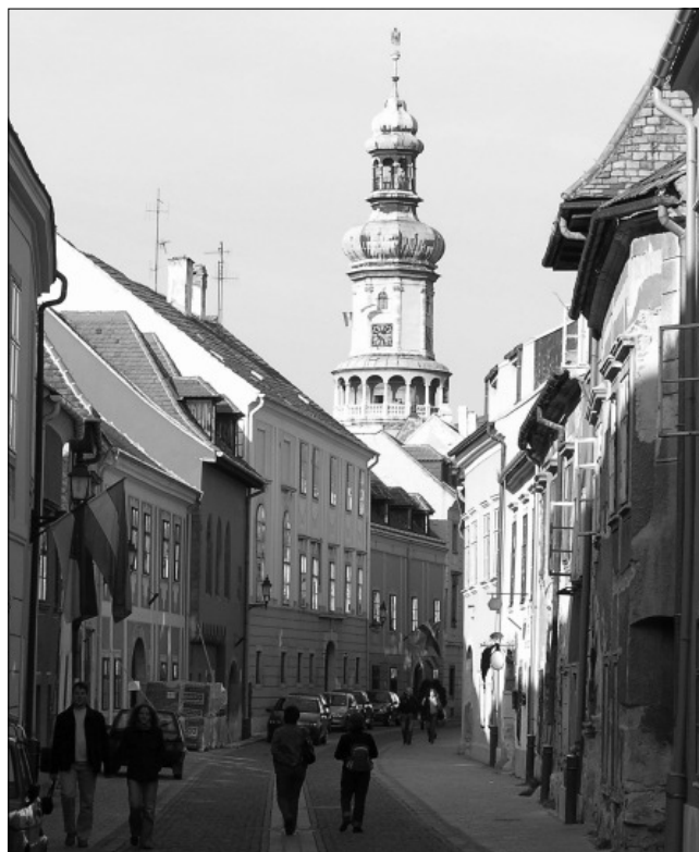
A soproni Tűztorony csúcsa

A városok gyakran emeltek tűztornyokat is. Gondoljunk csak például a soproni, a veszprémi vagy a szécsényi tűztornyra! Szerepük lényeges és hasonlatos volt a – főként az Alföldön található – templomok tornyán körbefutó tűzkiáltó erkélyhez. Ha a vörös kakas fölütötte a fejét valahol a városban, a torony erkélyén álló őr feladata volt a harangot megkondítani, s zászlóval a tűz irányába mutatni.