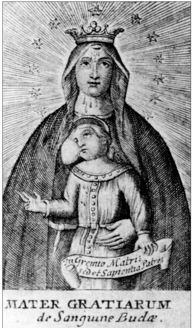
A buda-krisztinavárosi Vértó Szűzanya kegyképe 1750 körül, ismeretlen rézmetsző műve.

Ilyen csoda volt az is, hogy amikor 1723 tavaszán leégett a kápolna, a Kéményseprő Madonna meg-