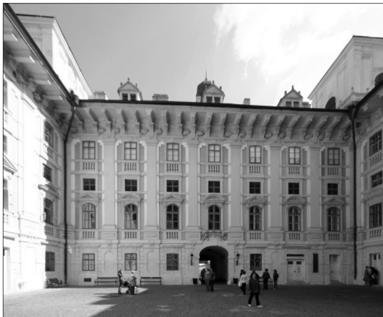
Az Esterházy kastély belső udvara