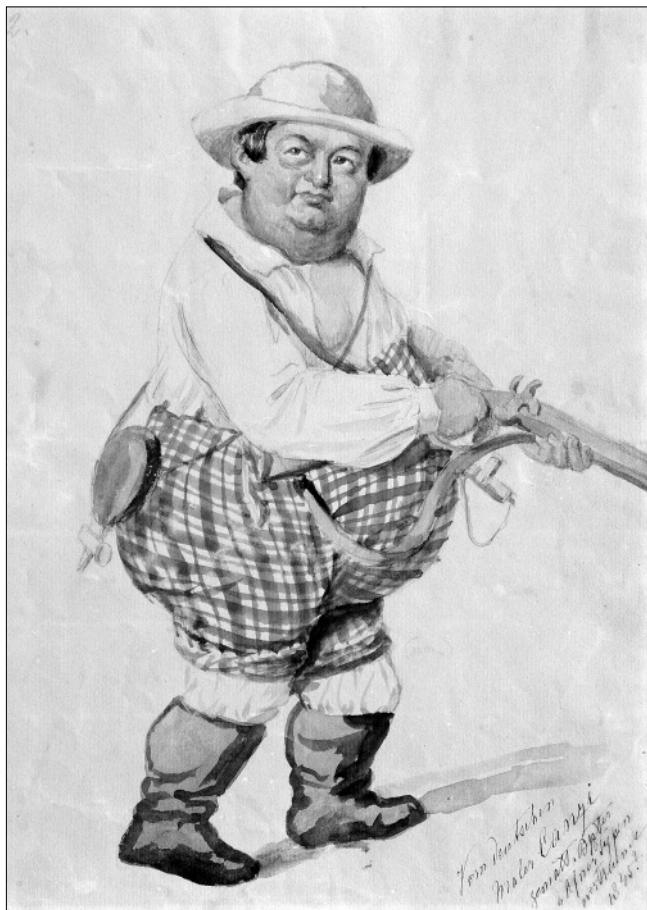
Canzi Ágost : Vadász karikatúrája (akvarell)