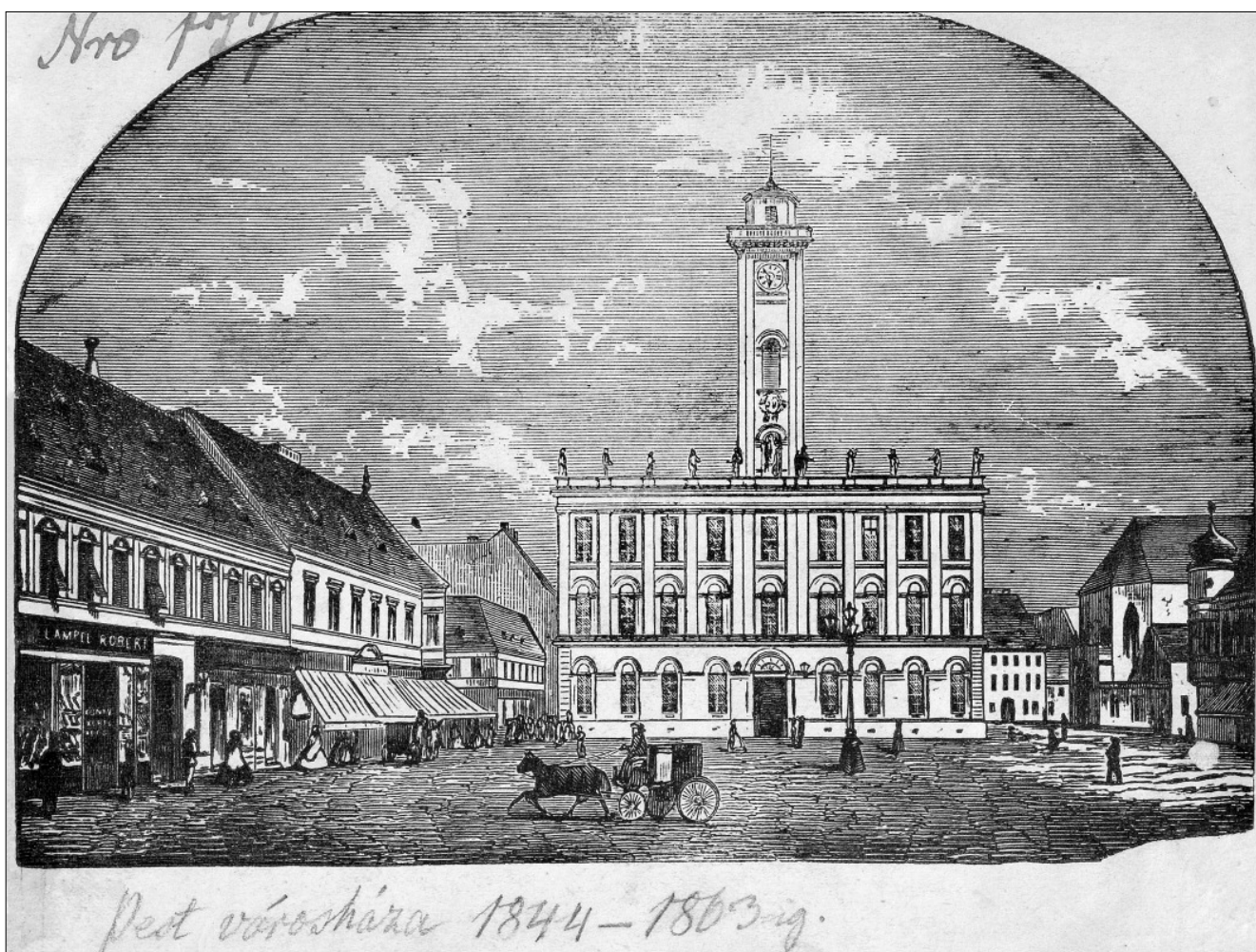
A pesti Városháza a XIX. század közepéről, ismeretlen mester metszetén

ból egységesen a német nyelvet használták egymás kölcsönös megértésére és a hivatali ügyintézés során úgy a magyar, mint a sváb, a zsidó, a szerb, a görög, a bolgár és más népesség is. A Weber Henrik 1840-es évekből fennmaradt meghívóján a szereplő férfiképmás a Pesther Tagesblattot tartja a kezében, de a Pesther Deutsches Theater 1855-ös, a Szent Rókus Kórház javára rendezett karácsonyi jótékonyági hangversenyének plakátja is jelzi, hogy Pest, Buda és Óbuda lakóit a művelődési élet, a közös kultúra hozta közelebb egymáshoz. A Budavári Palota barokk csarnokában szeptember 19-ig látható kiállításon a Budapesti Történelmi Múzeum saját anyagából valamint hat fővárosi társintézmény kölcsönzéseiből az ezekről a kapcsolatokról közel 250 műtárgy nyújt