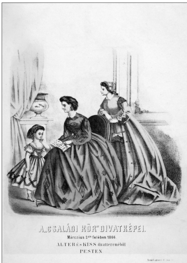
A „Családi Kör” divatképe (1866)