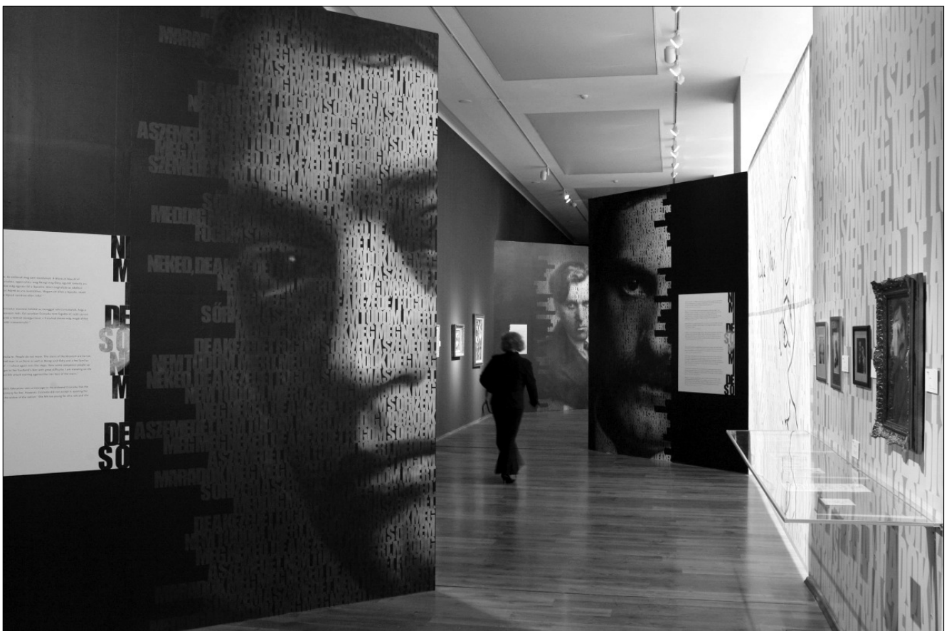
Debreceni tárlat-részlet Ady, Babits és Márffy óriás-fotóival