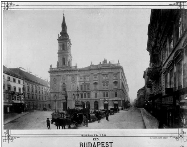
A Szervita tér a templommal és a rendházzal az 1800-as évek végén