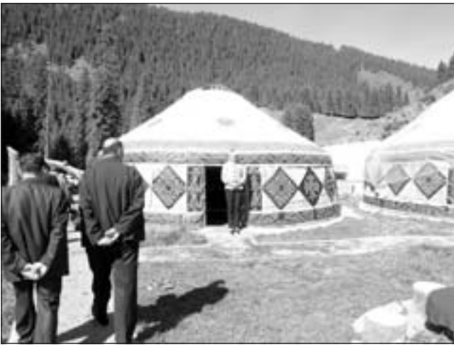
Kazah skanzen az Ég tavánál