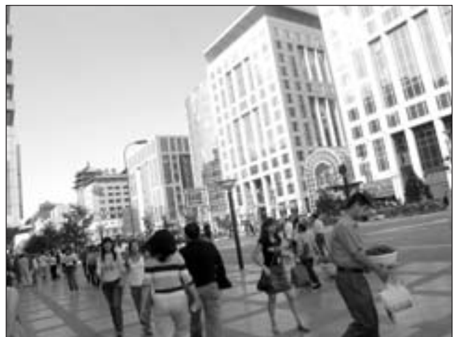
Két pekingi utcaszélet