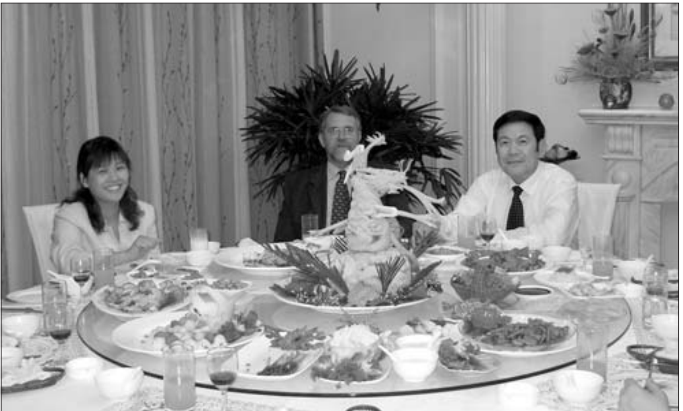
A kínai konyhaművészet remekei, közepén a sárgadinnyéből faragott Sárkánnyal