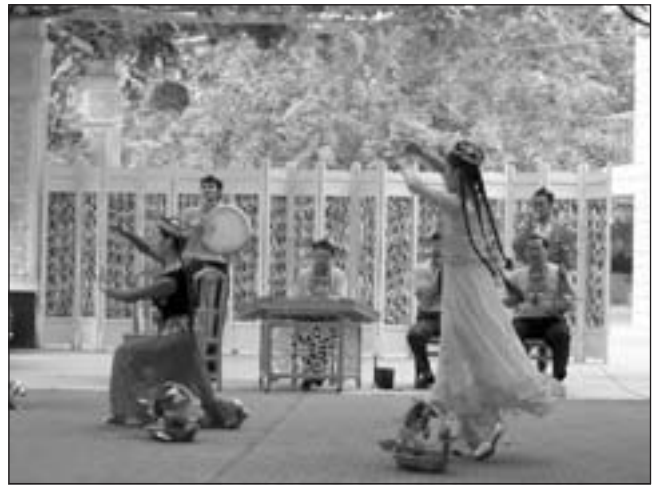
Ujgur népi táncosok és zenekar közepén a cimbalommal