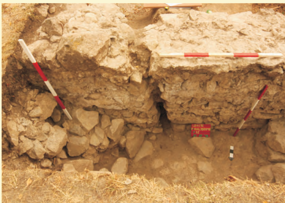
A meghasadt északi hajófal és a melléje épített megerősítés

A 2013. évi lövetei régészeti ásatások egyik leglátványosabb lelete a 82. számú sír volt. Ugyanis az újkori sírból előkerült férfi csontváz nyakában, egészen a csípőjéig lecsüngő, szalag alakú liturgikus ruhafoszlányt, vagyis stólat „viselt”, aminek elszíneződött szegőanyaga meglepő ép-