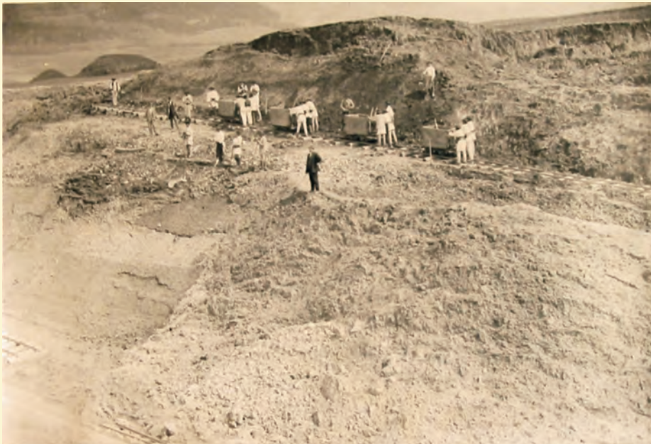
A Segesvár–Szentágota vasútvonal építése (www.agnetheln.ro)

válságállapotokat idéz elő Délkelet-Erdélyben, míg a Partium – más gazdasági irányultsága okán – ebből jószerezivel semmit sem észlel.