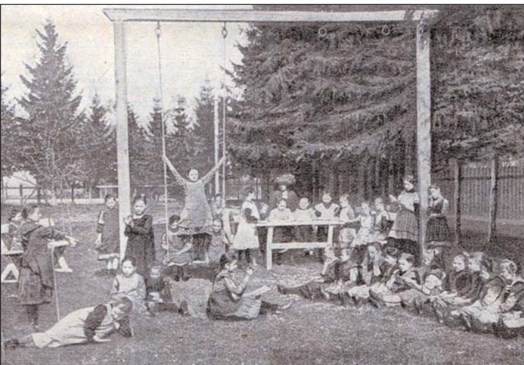
A zborói internátus játszótere (archív)

adta ki. A gyermekek nevelési és élelmezési költségeihez a szülők a következő csekély összeggel járultak hozzá: