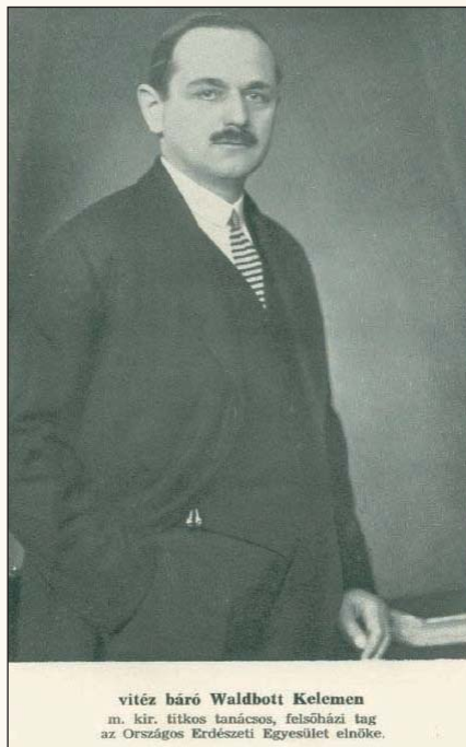
vitész báró Waldbott Kelemen m. kir. titkos tanácsos, felsőházi tag az Országos Erdészeti Egyesület elnöke.

A CIS könyvgyűjteményét nemzetközi gyűjtőmunka és cserék révén hozta létre. Több intézmény könyvtára mellett egyebek között megvásárolták az Eisenach-i Erdészeti Akadémia könyvtárát is. 1943-ban már 15 277