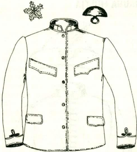
Szolgálati ruha zubbonya. Sötétzöld kelme, világoszöld paroli, felügyelőségeknél veres szegéllyel

bojt nélkül. (EL. 1882. 1026. o.) aláírás: Matlekovich.