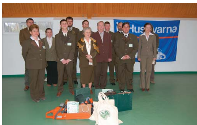
A hazaiak trófeáikkal a verseny után