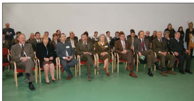
Tanárok, támogatók, vendégek