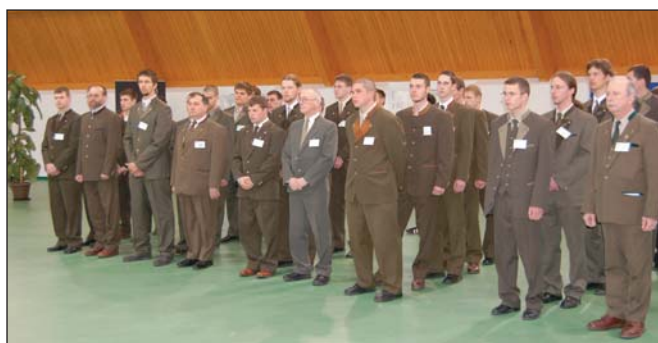
A résztvevő versenyzők a felkészítő tanáraikkal