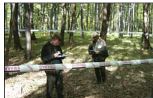
Jelölték a pilisi erdészek ..... 168

Madarak és Fák Napja a szombathelyi parkerdőben ....167