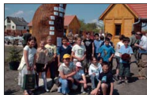
Madarak és Fák Napja 1906–2007. ....166

Madarak és Fák Napja a szombathelyi parkerdőben ....167