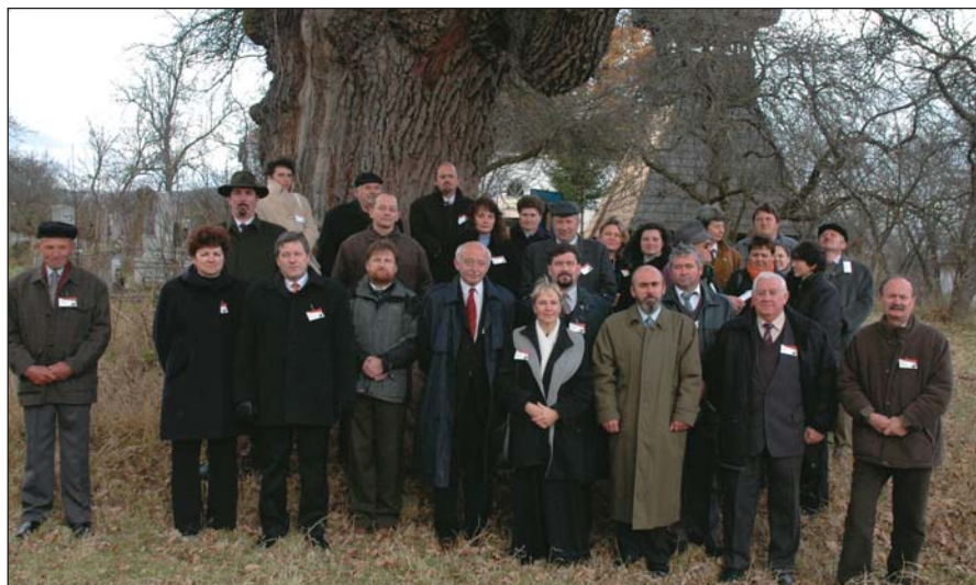
A résztvevők egy csoportja a kálnoki temetőben