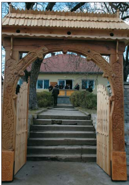
Az iskola bejárata