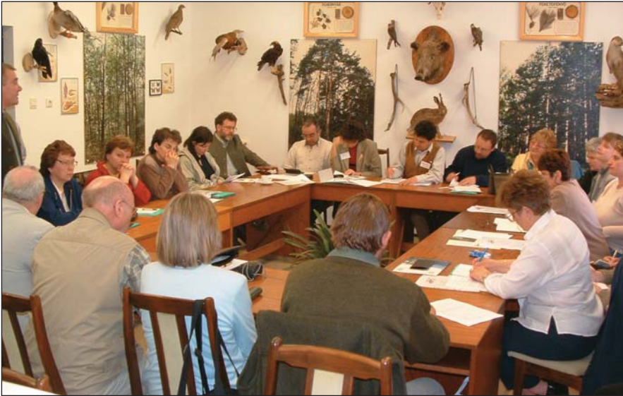
A szeminárium résztvevői

A VIII. Erdőpedagógiai Szemináriumnak a NEFAG Rt. Erdői Művelődési Háza adott otthont Szolnokon. A szeminárium célja az volt, hogy betekintést adjon a természetvédelmi oktatás-nevelés „Szolnoki Modell”-jéről.