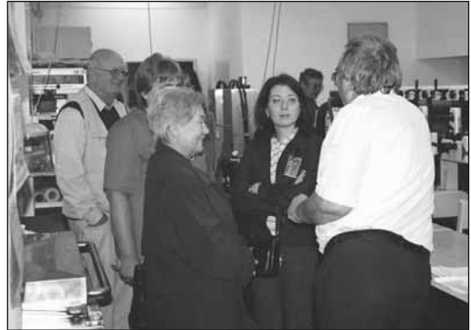
Látogatás a Helikon Nyomdában

Különböző alapanyagokra dolgoznak - papírra, műanyagra, alumíniumra, fóliára – nyomtatnak 1-9 színig, akár a ragasztóoldalra is.