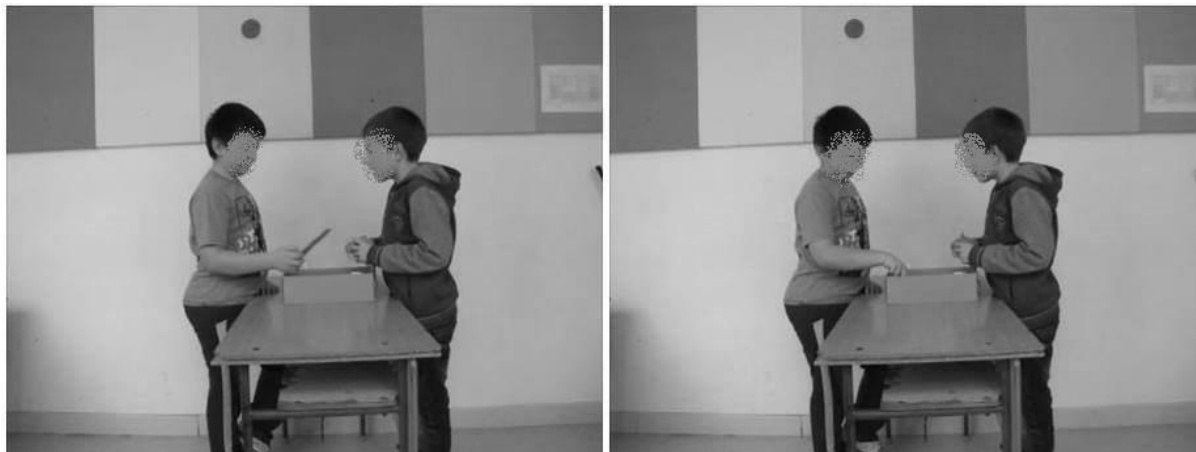
5. jelenet. Tárgy felmutatása (javaslat) és a fej oldalra billentése (beleegyezés)