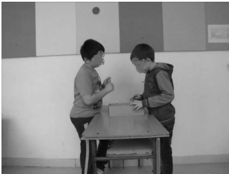
6. jelenet. Tűzcsiholás