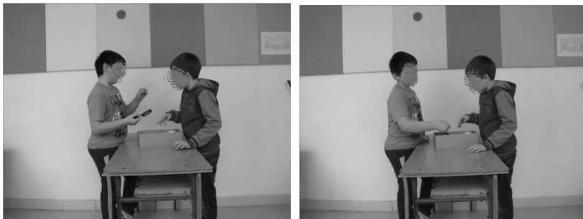
2. jelenet. Nagyító indoklása páros munka alatt