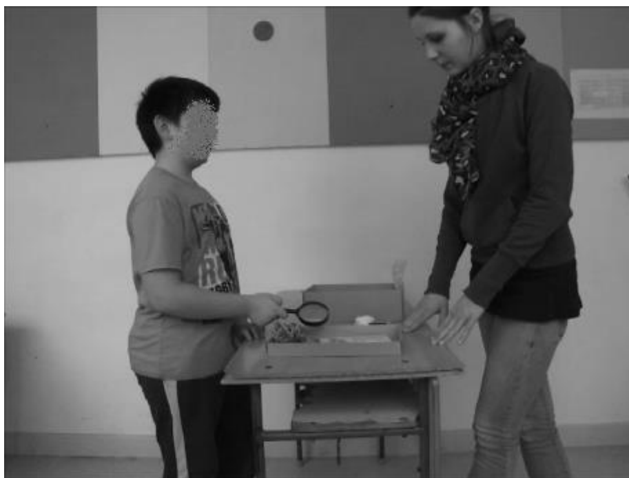
1. jelenet. Nagyító indoklása interjúban

Ugyanarról a tárgyról az érvelés különbözött az interjú és a páros munka helyzetében. Az eltérés a nagyító (lásd 1. és 2. jelenet), a fertőtlenítő szer (lásd 3. és 4. jelenet), illetve a kövel való tűzcsiholás melletti érvelés gesztushasználatában mutatkozott meg leginkább.