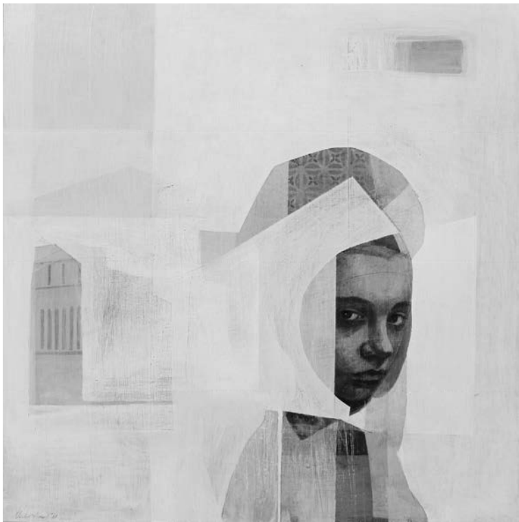
PROFÁN MADONNA VII. 2018

A regény amellett, hogy sajtáságos módon beszél a rendszerváltásról és az azt megelőző korszakról, a vidéki és a városi élet ellentéteződésének kivonata, ugyanakkor a halálvágy és az élni akarás harca is. Vitus István saját életében végbemenő változás és az ennek keretét adó történelmi esemény számtalan lehetőséget láttat, ugyanakkor egy a korábbiaktól eltérő szabadságról is árulkodik. A taxisblokáddal körbezárt, lelassuló város mintha veszítene má-morosságából. A rendszerváltással a fiatalok számára más, a korábban megszokottól eltérő párkapcsolati forma is lehetséges lenne, ők viszont a házasságkötést választják. Az esküvő utáni sejtelmes mosoly meghagyja az olvasó számára azt a lehetőséget, hogy elgondolkod-hasson a választás, a váltás helyességéről.