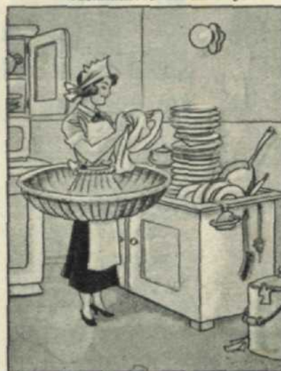
Védekezés a tányértörés ellen. (Berliner Illustrierte.)