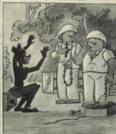
— Te, ez a benszülött azt mondja, hogy az üvegyöngyök helyett in- kább a rádióját javítanánk meg (Tit Bits.)