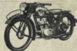
120-as Tornax az ideális kis motorkerékpár.