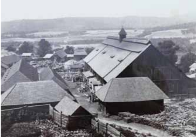
1. kép. A bükszádi üvegcsűr – Gere István fotója (1898) a SZNM fototékájából, lelt.szám: 1188-K/8130.