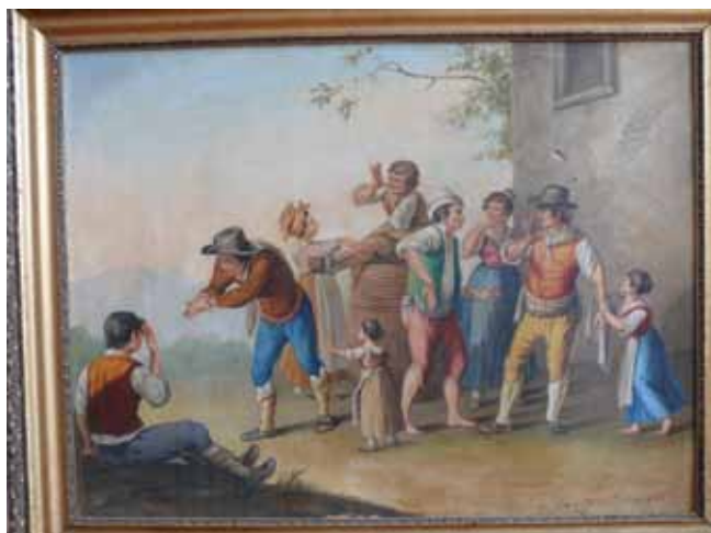
23. kép. Xavier della Gatta: Süketék jelbeszéde (1818) – Sovánka István másolat.