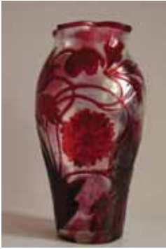
15. kép. Sovánka pipasos, iriszes vázája – SZNM történelmi gyűjtemény, lelt.szám: 759.