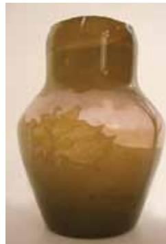
19. kép. Sovánka libás, befejezetlen, szignált vázája – SZNM történelmi gyűjtemény, lelt.szám: 753.