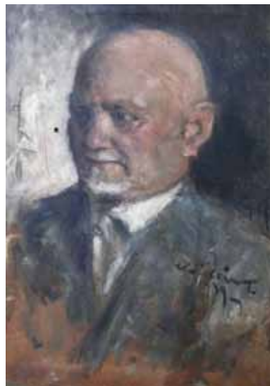
7. kép. Sovánka István öregkori portréja – Kádár Tibor festménye (1936).