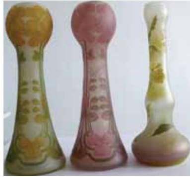
16. kép. Sovánka réteges, maratott vázái – a leszármazottak tulajdonából.