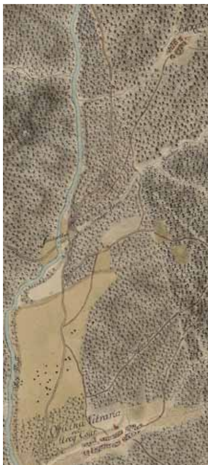
5. kép. I. Osztrák Katonai Felmérés térképe (részlet).