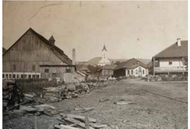
2. kép. A sepsibükszádi üvegcsűr a századfordulón.