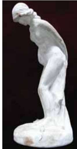
20. kép. Sovánka István: Női akt egérrel – a leszármazottak tulajdonából.