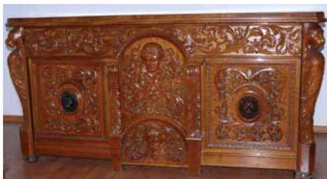
10. kép. Sovánka által faragott íróasztal.