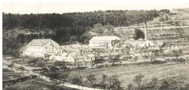
9. kép. Zayugróc látképe az üvegyárral – korabeli képeslap.