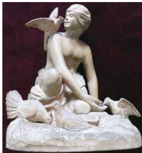
21. kép. Sovánka István: Akt galambokkal – a leszármazottak tulajdonából.