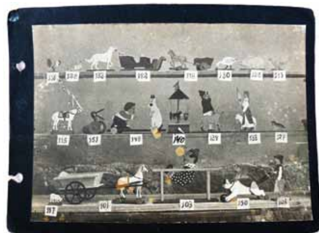
13. kép. Sovánka mozgó játékaikat ábrázoló eredeti Sovánka felvételtől készült másolat.