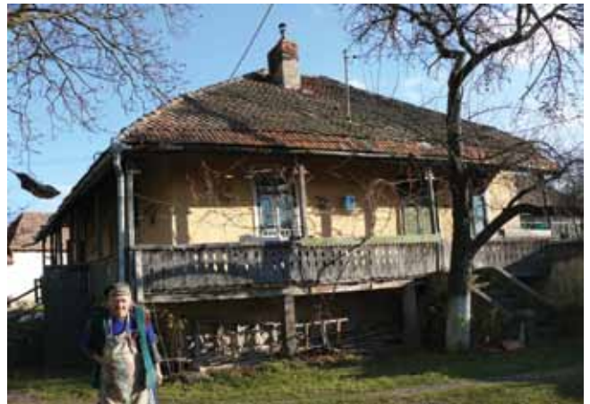
4. kép. Az üveggyár egyetlen ma is álló épülete, az irodaház, ma lakóház. (2008. szerző felvétele)