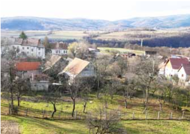
3. kép. A bükszádi üveggyár helye ma, a katolikus templom tornyából (2008. szerző felvétele).