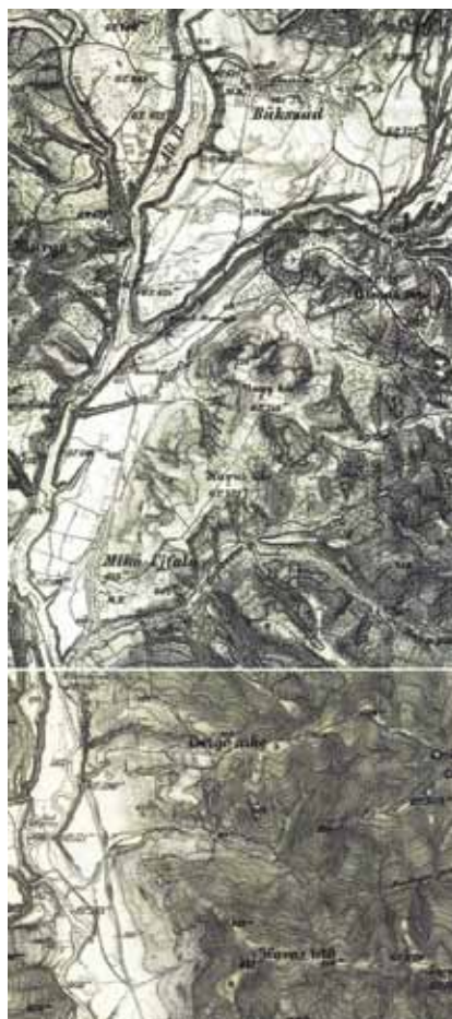
6. kép. II. Osztrák Katonai Felmérés térképe (részlet).

kezdődött és meddig tartott egyik illetve a másik helyen. Tény az, hogy az 1768-as I. Országos Katonai Felmérés térképén a „Sombortöve” erdőség tisztását az Olt szeli át és a „Sombor patak” is bővebb vízhozamú (mára kiszáradt), de a tőle délre eső település „Officina Vitaria vel Üveg Csür” (azaz a mai Mikóújfalu) már templommal, malommal rendelkezik, tehát korábban létesülhetett mint Bükszád és a közepes települések közé sorolandó (5. kép). A Zsombor-tővétől északkeletre találjuk „Bükszád”-ot, ami az előbbi „Üveg Csür” település fele és még nincs temploma, tehát később is alapított, mint a ma Mikóújfalu nevet viselő, a térképen „Üveg Csür”, a dokumentumokban csak „Ujfalu”-ként emlegetett település. Elképzelhető, hogy a Mikóújfaluból Bükszadra való átköltöztetés nem szüntetett meg minden munkát a korábbi helyszínen és akár évekbe is beletelt amíg Mikóújfalu hutáját teljesen feladták.