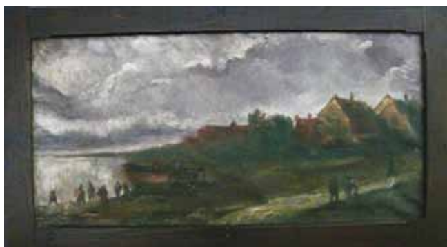
24. kép. Sovánka István: Vihar (1908).