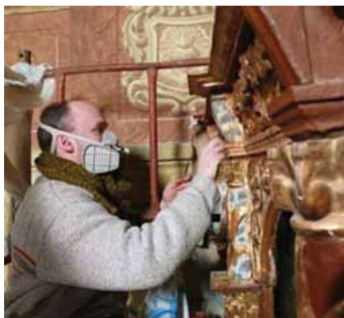
14. kép. A barna átfestések eltávolítása az ikonosztáz felépítményé- ről.