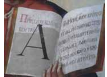
13. kép. Az eredeti szöveg feltárás közben.