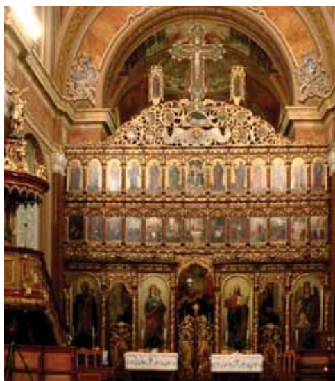
3. kép. Az ikonosz- táz restaurálás előtt.