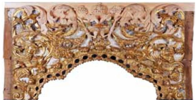
23. kép. A Királyi kapu fölötti baldachin csonkított címerfaragványának kiegészítése hársfából.

A restaurálás során az ikonosztáz építménye visszanyerte eredeti barokk jellegét, részben színvilágát, de megőrizte a 19. századi aranyozás nagy részét a faragványokon, és az ikonokat is. Ugyanakkor a régi gyökereket kedvelő hívek és zarándokok megcsodálhatják az építményt koronázó oromzatot, mely a 18. századi állapothoz közelít (22. kép). S végül, a 21. század is hozzáadta a maga jelét: