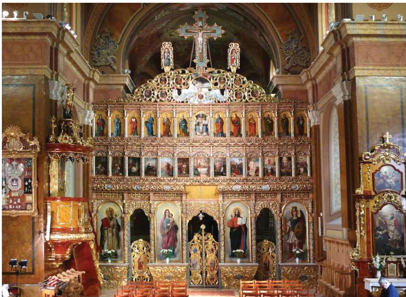
26. kép. A restaurált ikonosztáz.

A restaurálást követően az ikonosztázt átadtuk a zarándokoknak, a megújult templomot 2010. szeptember 11. megszentelte dr. Kocsis Fülöp megyéspüspök, szentbeszédet mondott Christoph Schönborn bíboros, bécsi érsek (26–27. kép).