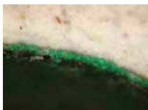
6. kép. Zöld levélből vett minta. Sztereo-mikroszkópos kép (az objektív nagyítása kb. 60x).