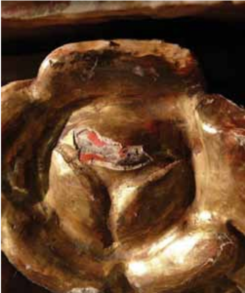
8. kép. Virág vörös festése a 19. századi alapozás és aranyozás alatt.