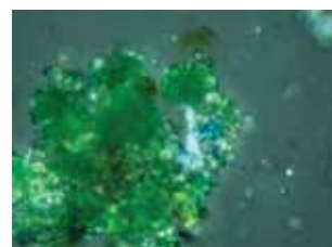
7. kép. A zöld pigment polari- zációs mikroszkópos képe (az objektív nagyítása 40x) részben keresztezett polarizátor állásnál.