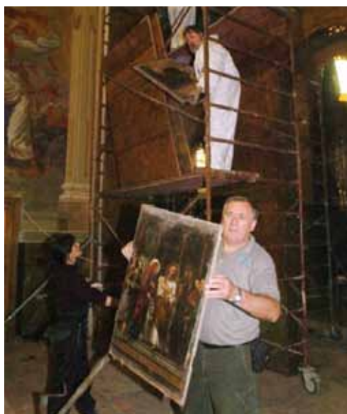
4. kép. Az ikonosztáz bontása.