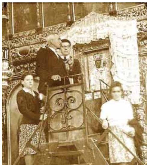
2. kép. Hívek a Királyi kapu fölé helyezett kegyképnél.