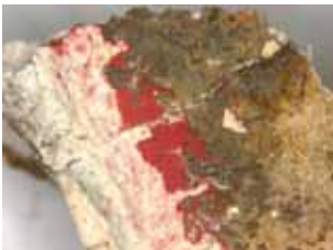
9. kép. A vörös virágokból vett minta. Sztereo-mikroszkópos kép (az objektív nagyítása kb. 5x).