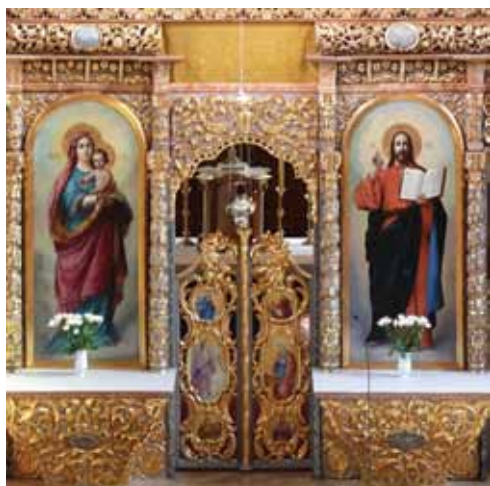
24. kép. A baldachin fölötti megcsontkított rész.