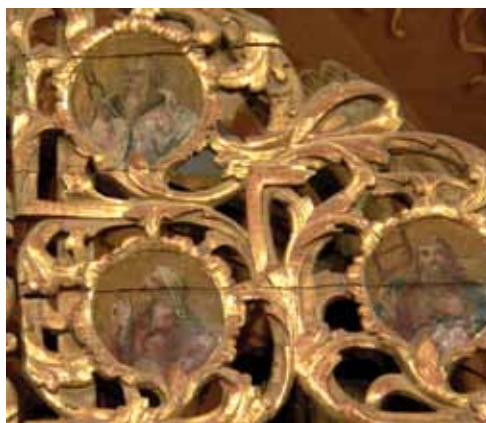
17. kép. A Spisák által átfestett és átaranyozott oromzat részlete.