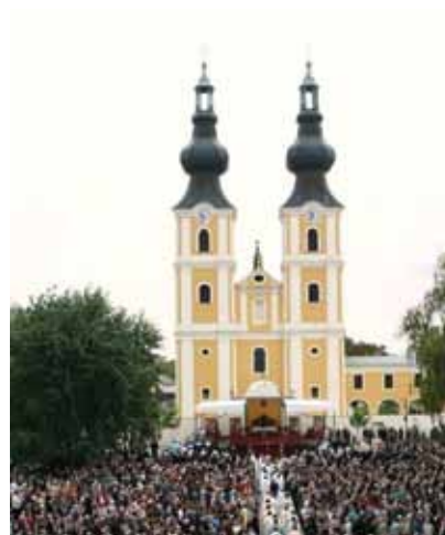
27. kép. A máriapócsi templom újraszentelése 2010. szeptember 11-én.