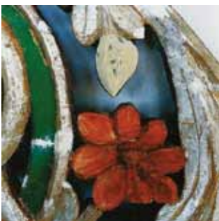
11. kép. A lozeni (Bulgária) Szent György templom ikonosztáznak részlete