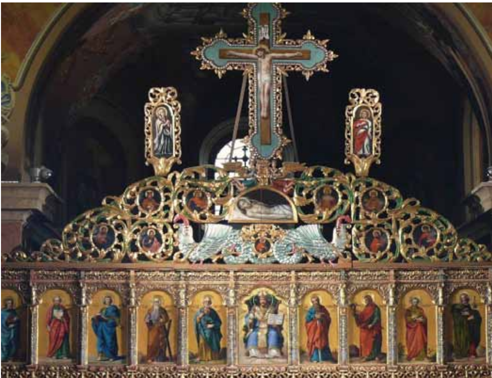
22. kép. A restaurált oromzat.