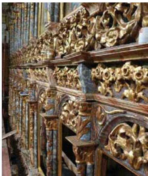
15–16. kép. A barna átfestés eltá- volítása után kék-arany az uralkodó szín.