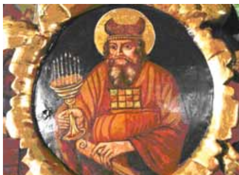
18–19. kép. A festékréteg kutatása során Spisák Gyula lazán megfestett Ézsaiás próféta ábrázolása alól előbukkant Zakariás próféta alakja.

megőrizzük és helyreállítjuk a Spisák féle aranyozást és az általuk festett ikonokat, de eltávolíthatjuk az összes barna átfestési réteget, hogy az ikonfal visszanyerje a 18. század közepi színes márványfestését (14–16. kép).