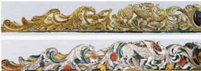
a. 19. századi átaranyozással. b. az átaranyozástól megszabadított eredeti színezés.

A vörös festés esetében a mikroszkópos keresztmetszet-csiszolatokon a vörös réteg és az alapozás között helyenként aranyozásréteg található, azaz, a korábbi kifestéskor először az aranyozásréteget készítették el, majd utána hordták fel a vöröset. Átmenő fényben a vörös