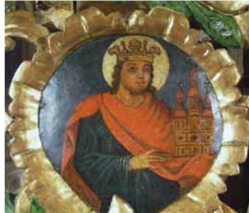
20–21. kép. Spisák Mózes ikonja alatt rejtőzködött Salamon alakja, baljában a templommal.