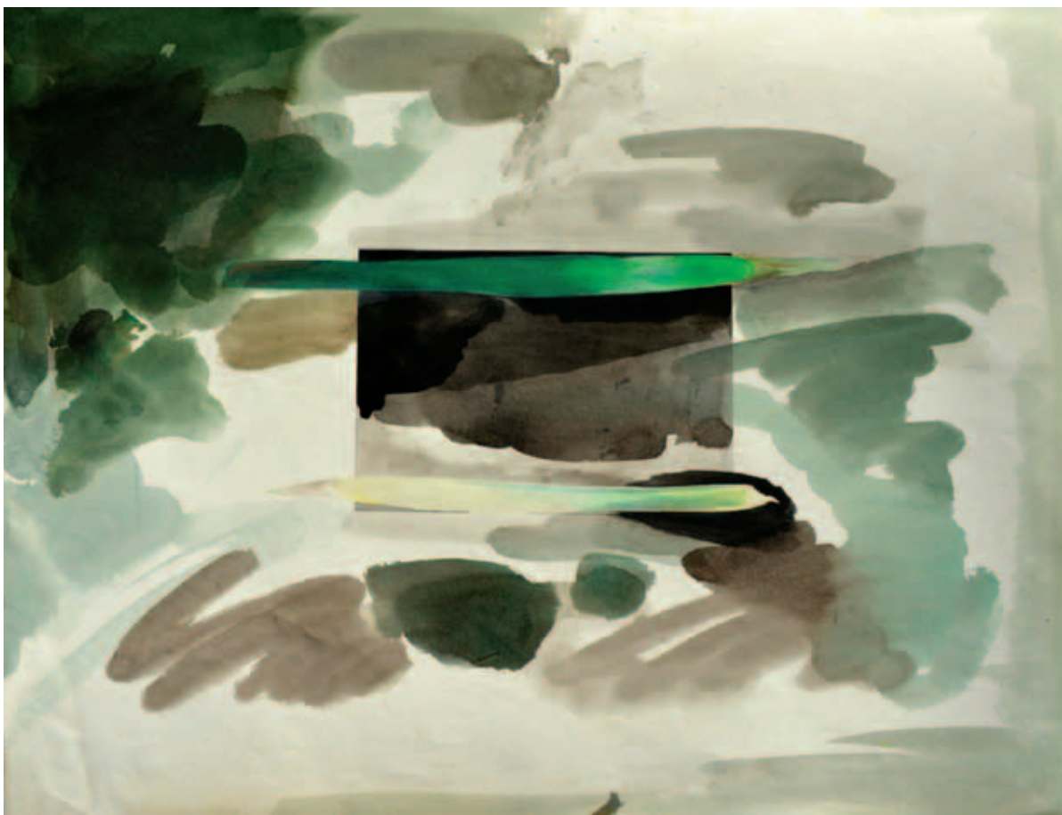
KEREKES GYÖNGYI, Prokrusztész ágya I-II., 1989