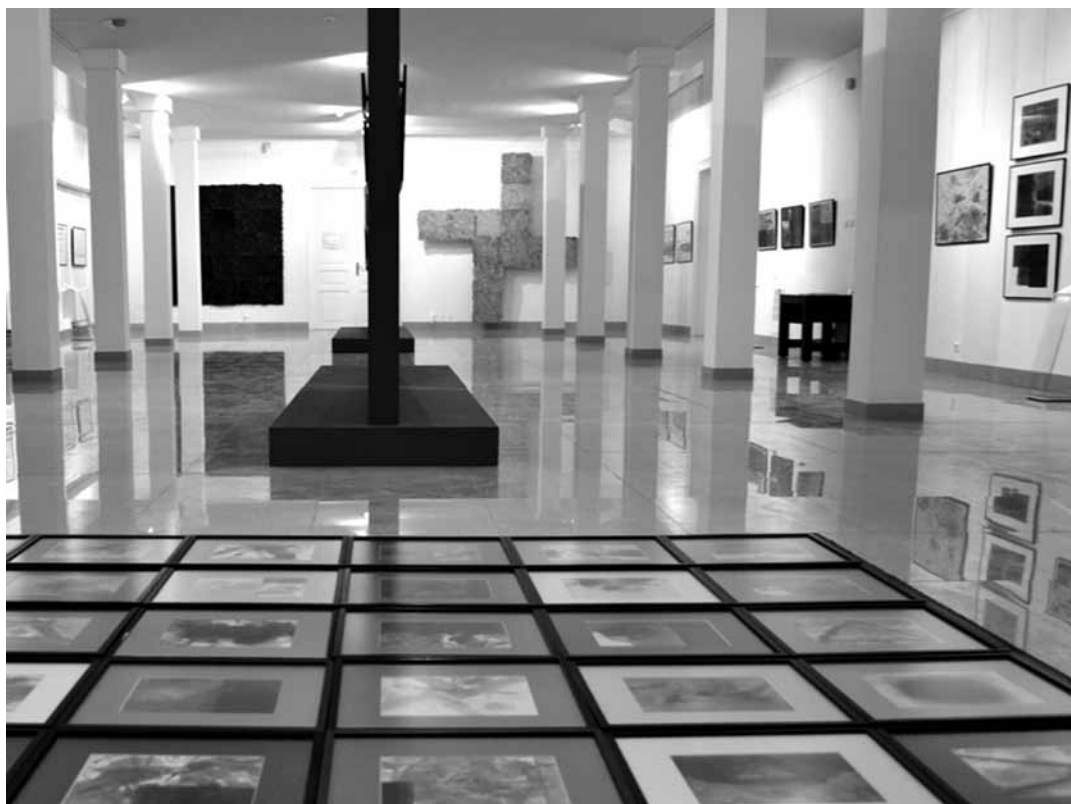
KEREKES GYÖNGYI, Belső lépcsők c. kiállítás, 2020–21, Nagyvárad (részletek)