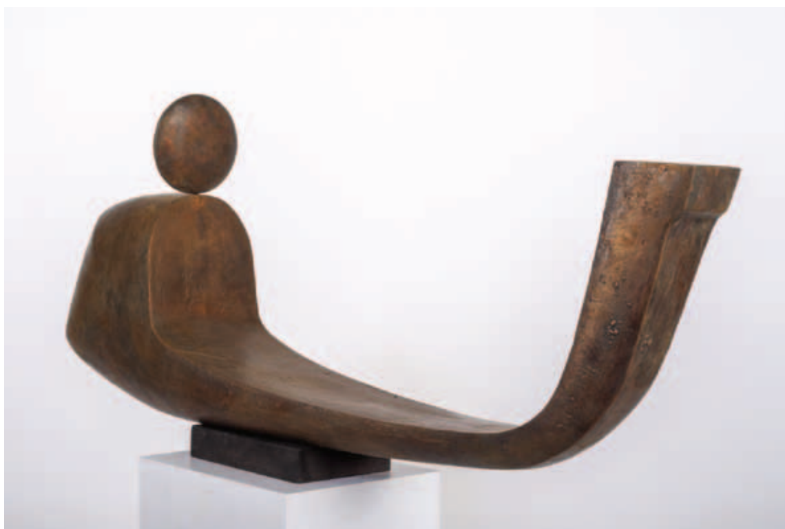
RÉVI NORBERT, Duat, 2019