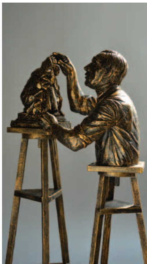
POGÁNY GÁBOR BENŐ, Amerigo Tot, 2019