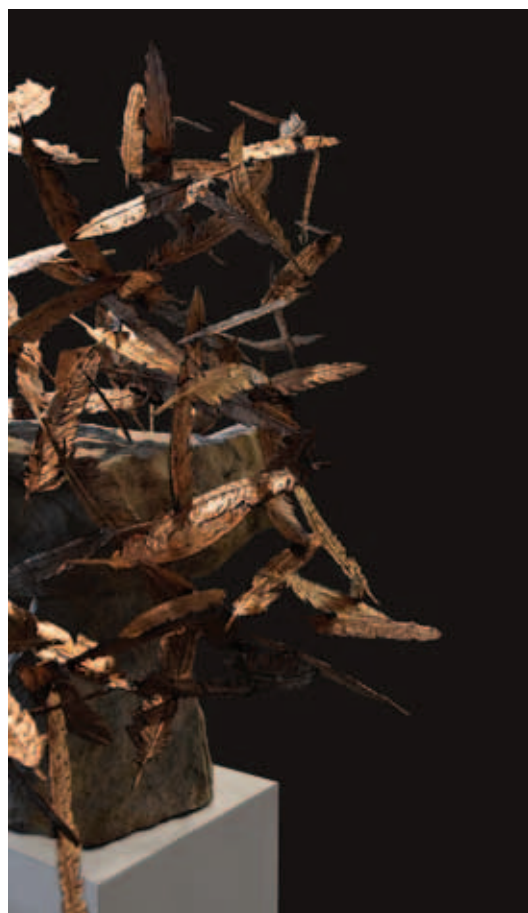
MESZLÉNYI MOLNÁR JÁNOS, Ikarosz bukása, 2008; Ikarosz bukása, 2019 (részlet)