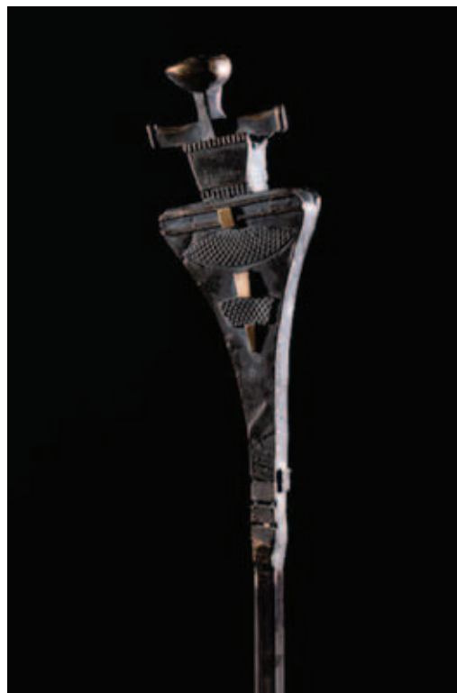
SZABÓ GYÖRGY, Archaikus emlék I–II., 2019