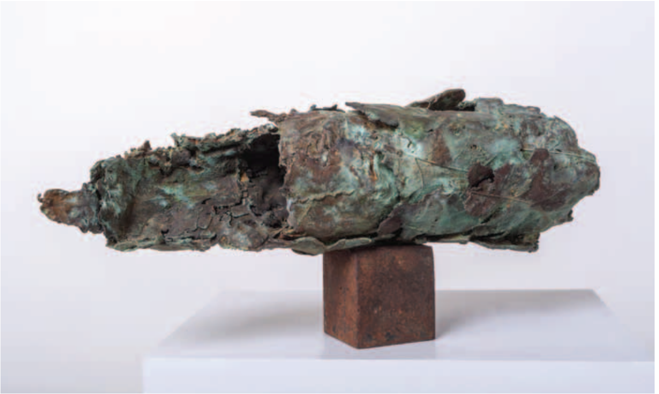
GÁLHIDY PÉTER, Haladó palack, 2019