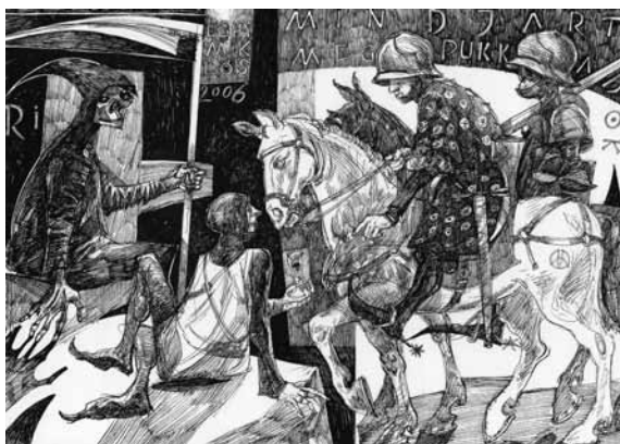
UGHY MIKLÓS, Gergelytánc (Boldog szomorú rajz) , 2007; Lovas ( Mindjárt megpukkadok ), 2006