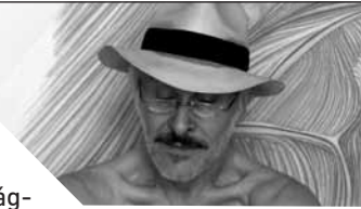
GOSZTOLA GÁBOR (1945–2018)

Munkáim nem szívesen, vagy csak igen ritkán tekintem árucikknek, anyagi értékhozóknak. Ezért aztán, (hogy ezt elkerülhessem) a legkülönbözőbb köznapi tevékenységeket végeztem. Könyveket lektoráltam, négerként irodalmi műveket dramatizáltam, voltam kiállításrendező, esztétikai