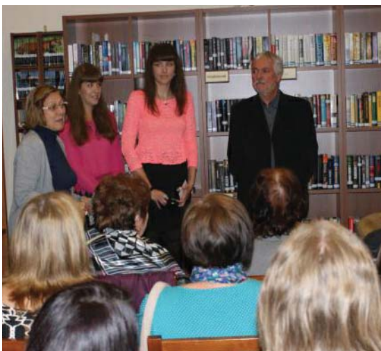
Mester és tanítványai

Havonta más és más kiállítás várta az érdeklődőket a könyvtár folyosóján ősszel is, amelyek közül az októberi és a decemberi kiállítást emelném ki.