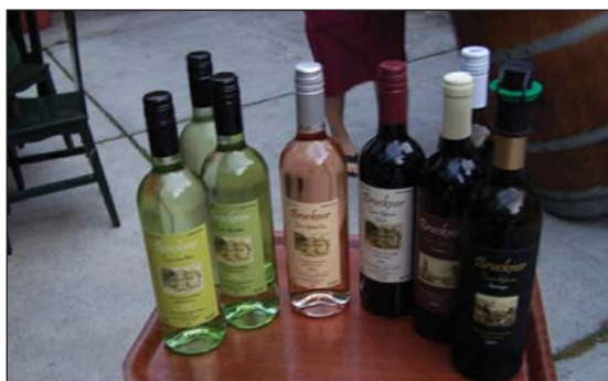
Kóstolható kortyintáshoz falatkák...

A hivatalos program után lehetőségünk volt a hűség városával ismerkedni, majd este megpihenhettünk, egy helyi borász kellemes kertjében feledhettük a nap fáradalmait. Közben megismerkedhettünk a híres soproni borászat történetével, kóstolgatva finom nedűit.