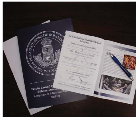
Az elkészült promóciós csomag

A kézirat megküldésének pillanatáig a csapat előadást tartott a Lónyai Utcai Református Gimnázium és Kollégium, a Szent Margit Gimnázium, a Csik Ferenc Általános Iskola és Gimnázium és a Szinyei Merse Pál Gimnázium több végzős osztályának, melynek során viszonylag kiterjedt empirikus tudásra tettünk szert azzal kapcsolatban, hogy napjaink érettségi és pályaválasztás előtt álló fiataljai milyen információkkal rendelkeznek és hogyan gondolkodnak a magyar felsőoktatásról vagy éppen a könyvtáros szakma ismertségéről-elismertségéről. A tapasztalatok sajnos nem feltétlenül adnak okot komolyabb bizakodásra, és ez főleg a magyar felsőoktatási rendszerbe vetett közbizalom hiányában érzékelhető. Ez talán nem is annyira meglepő, ha csak az utóbbi hónapok kaotikus viszonyaira és eseményeire gondolunk, amelyek a diákok nagy részénél komoly tanácstalanságot váltottak ki. Az államilag finanszírozott keretszámok körüli polémia és bizonytalanság sajnos nem tett