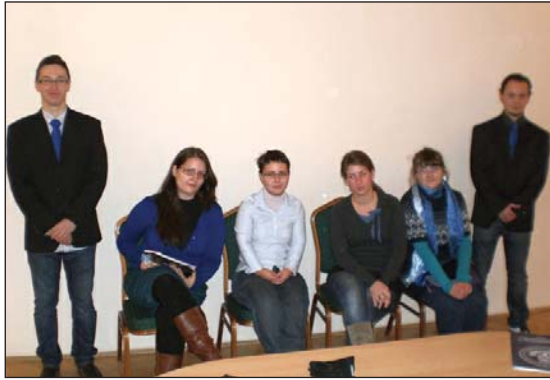
Csoportból csapat, avagy a kampánykörút szervezői

tíva közül végül amellet döntött a csapat, hogy a „forgószínpad-szerűen” megtartott, nagyjából félórás, prezentációval színesített előadások során különös figyelmet fordítunk egyrészt az oktatási tevékenység tartalmára, másrészt pedig az egyetemen és a karon folyó aktív hallgatói élet bemutatására. Ennek megfelelően a bölcsészettudományi kar és az intézet tradícióinak, a humántudományok területén betöltött szerepének, illetve a magyar felsőoktatásban elfoglalt helyének prezentálása után az intézet bachelor és master képzésein elvégezhető információ- és tudásmenedzsment, EU-információ, üzleti információmenedzser és kutatás-fejlesztési menedzser szakirányain látogatható kurzusok sorát ismertettük röviden. Az oktatási tevékenységgel kapcsolatos tájékoztatás során – mint utóbb kiderült, helyesen döntve – kiemelten foglalkoztunk az elhelyezkedési esélyekkel, illetve lehetőségekkel, felmutatva azokat az intézményeket és intézménytípusokat – a köz- és a versenyszférából egyaránt –, ahol az utóbbi évek tapasztalatai alapján sikerrel helyezkedtek el végzett hallgatóink. Szintén jó döntésnek bizonyult a pezsgő hallgatói élet részletes bemutatása, melynek során az előadók saját élményeiket is felelevenítve osztották meg a gimnazistákkal a kari gólyatá-