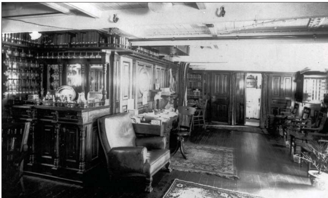
A USS Olympia tiszti pihenője

könyvtárat. Ezeket a hajótest belsejében, illetve a hordozók esetében a repülőfedélzet alatt helyezték el. A napi tevékenység folyamatosan zavarta a nyugodt olvasást, kapcsolódást. A USS Lexingtonon és a USS Saratogán is közvetlenül a repülőfedélzet alá kerültek, a felső fedélzetre. El lehet képzelni, mekkora hangzavar lehetett itt, mikor el-