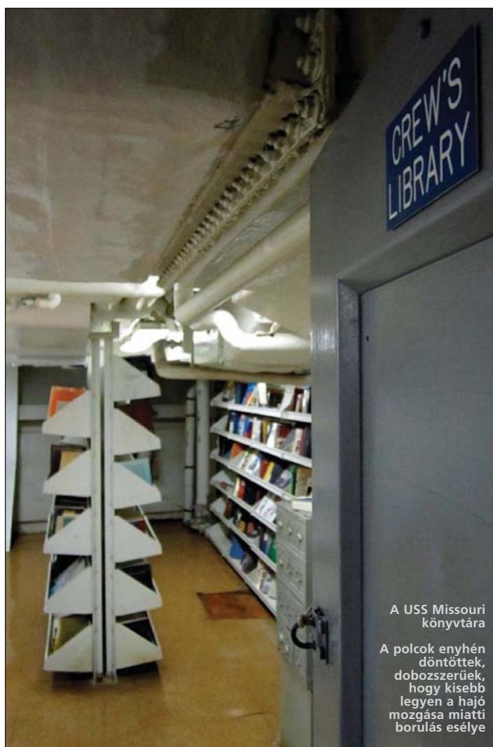
A USS Missouri könyvtára

hogy a hátréteg gyerekekről vagy állatfigurás paraván adja. A USS Harry S. Truman repülőgép-hordozón a Fehér Ház legismertebb szobája, az Ovális Iroda képét jelenítik meg. Itt a katona felolvassa az általa választott könyvet. Ezt DVD-re rögzítik és eljuttatják a családjához. A gyermek otthon a másik szülővel együtt megnézi felvételt, és ha van kéznél könyv, akkor követi a mesét. Eközben a gyermek