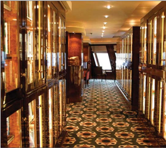
A Queen Mary könyvtára

Navigare necesse est, vivere non est necesse, azaz hajózni kell, élni nem kell – mondta Pompeius római hadvezér az ókorban. És valóban azok az államok lettek igazán hatalmasak, gazdagok, amelyek erős tengerészettel rendelkeztek. A tengerek feletti uralom biztosította – és biztosítja ma is – a gazdaság fejlődését. Nagy távolságokra, nagy tömegű árut csak hajóval lehet és érdemes szállítani.