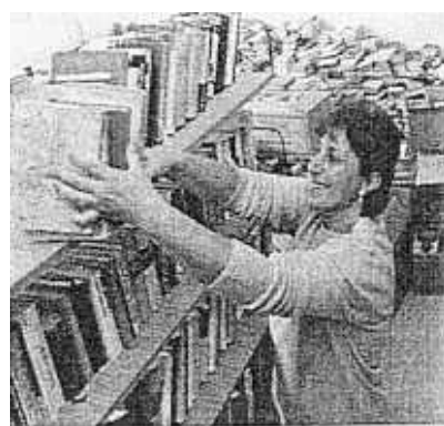
Pakolás a tiszaszalkai könyvtárban. Az iskolába költöztek

közel 800 ezer ember él ezekben. A hivatalos statisztikák szerint a kistélepülések közel kétharmadában van könyvtár, ám ezek szolgáltatása roppant változatos képet mutat. BAZ megyében 357 település közül „csak” 115-ben nincs könyvtár a statisztikák szerint. Az úgynevezett nyilvános könyvtári jegyzékben azonban mindössze 151 szerepel. A listára kerüléshez ugyanis meg kell felelni bizonyos, a könyvtárak működéséről szóló törvényben megfogalmazott elvárásoknak (lényegében igazolni kell, hogy működik), s állami pályázati pénzekhez is csak akkor juthat az intézmény, ha szerepel a jegyzéken. Vagyis a borsodi könyvtárak jó része nincs abban a helyzetben, hogy egyálta-