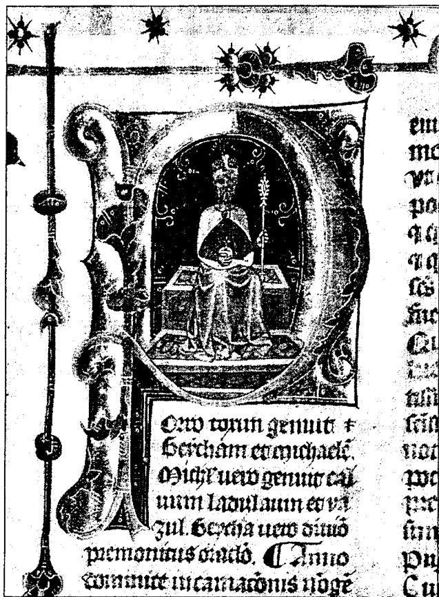
Képes Krónika „P” iniciálé (XIV. század)

csaknem 48 ezer bibliográfiai rekordja és 160 ezer állományadata szerepel az adatbázisban.