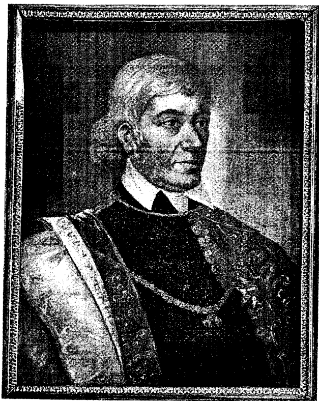
A könyvtáralapító Gróf Széchenyi Ferencről ismeretlen művész által a XIX. század közepén készített festmény

Az 1952 utáni dokumentumok másolatban való szolgáltatása hagyományos postai úton és elektronikusan történik. Az ODR-támogatásként 2001-ben kapott 779 ezer forintot PC, szkennerek és az Ariel elektronikus dokumentumtovábbító szoftver új verziója beszerzésére fordítottuk. Szeretnénk, ha az Ariel általánosan elterjedne a