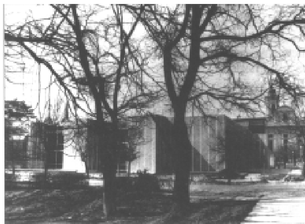
Az 1985. augusztus 20-án átadott új könyvtárépület

A fejlődés egyik eleme a könyvtárközi kölcsönzésben a másolatok kérése . A könyvek és folyóiratok árának emelkedésével számuk egyre nő, igyekszünk az igényeket kielégíteni – a szerzői jogi szabályok betartásával –, térítés ellené-