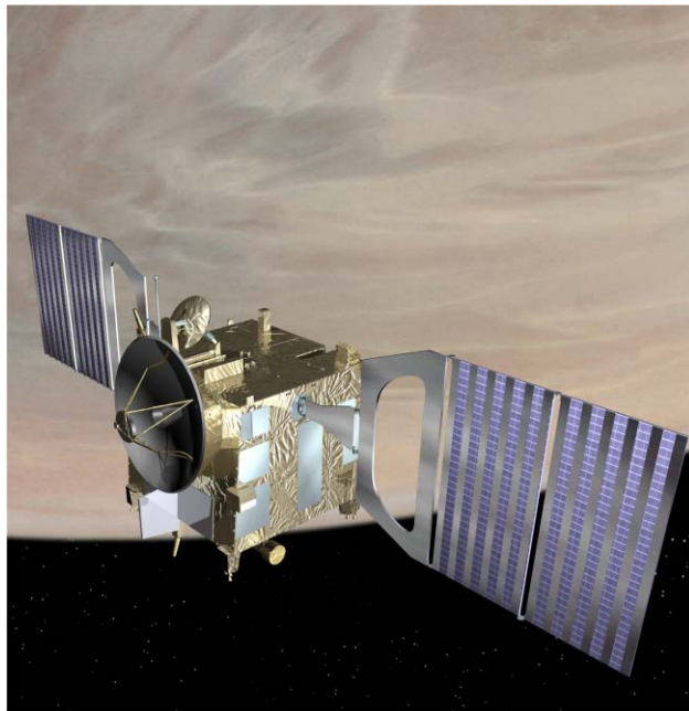
1. ábra. A Venus Express szonda a Vénusz felhői felett.