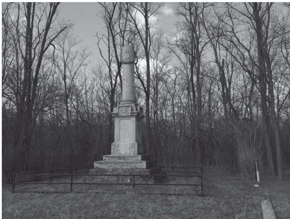
A honvéd emlékmű az 1-es főút mellett

a korabeli dokumentumokat, azonosítottuk az emlékmű eredeti felállítási helyét a terepen, felkutattuk az építmény maradványait, és megvizsgáltuk, hogy van-e az emlékmű alatt vagy környékén tömegsír?