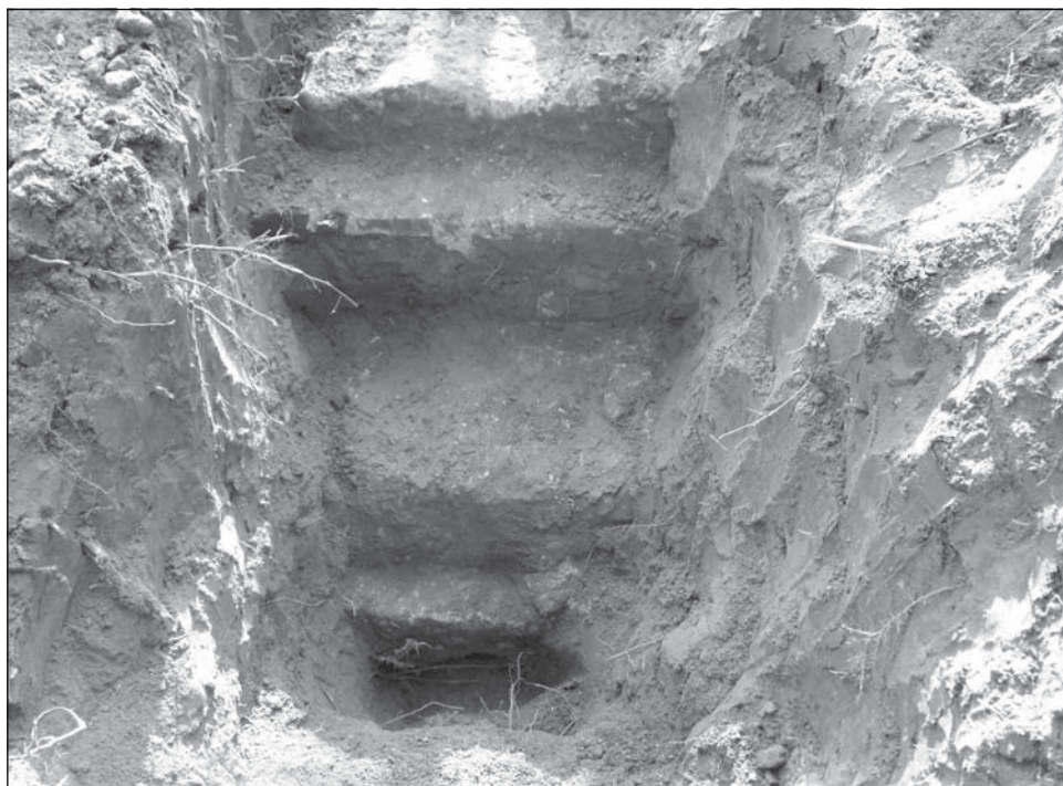
Az emlékmű alapjának lépcsős elrendezése

2015. május 30-án folytattuk a terepi kutatást. Mivel bizonyítottnak tekintettük, hogy az építmény alatt nincs tömegsír, fúrásokkal szeretnénk volna tisztázni, hogy az építmény közelében vannak-e sírra utaló nyomok. A fúrást 9 cm átmérőjű, csigás fúrófejjel szerelt talajfúróval végeztük, átlagosan 100 cm-es mélységig. A fúrás előtt 200 cm hosszú 1,2 cm vastag acélrúd szondával vizsgáltuk a talajt, hogy vannak-e nagyobb kődarabok, melyek akadályozhatják a fúrást. Az építmény körül igyekeztünk kitapogatni a kutatóaknál észlelt köves-habarcos sávot és ezen kívül fúrni. Az építmény szegélyétől számítva, átlagosan 180 cm-es távolságra, 200 cm-enként minden oldalon fúrásokat végeztünk. Az építmény környezetében észlelhető mélyedéseket szintén megfúrtuk. Ennek során az esetek többségében a homokos humuszos erdei talaj alatt elértük a sárga homok vagy szürke márgás altalajt. Egyedül a délkeleti oldal furataiban jelentkezett a kutatóaknál már észlelt fekete színű kötött talaj, ami a szürke márgás altalajig tartott. Ezt a réteget minden esetben keresztülfúrtuk az altalajig. A fúrások eredményeként megállapítottuk, hogy a fekete színű talaj jól körülhatárolható, közelítőleg 300x200 cm-es foltban helyezkedik el.