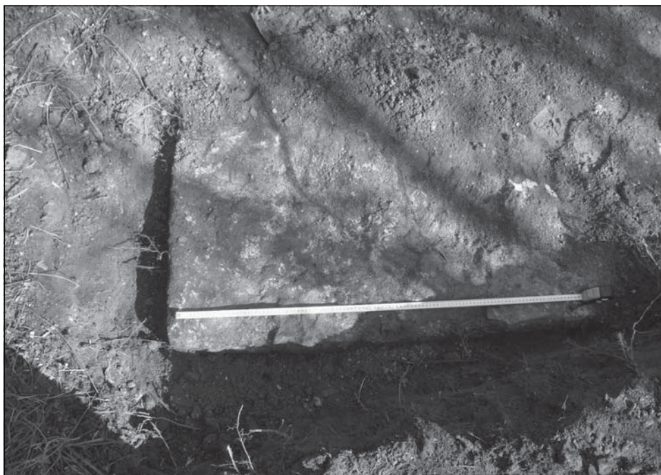
Az emlékmű alapjának nyugati sarka

Először az építmény nyugati sarkát, majd a keletit tártuk fel. A két pontot összekötő egyenes hosszából pontosan kiszámolható volt az oldalak 300 cm-es hossza, ami megegyezik az 1-es út mellett álló, jelenlegi emlékmű alapjának méretével.