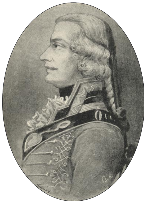
Báró felsőkubini Meskó József (Egykorú festmény alapján rajzolta Cserna Károly. Zichy 37. o.)

Kezdetben ügyvédnek készült, később azonban mégis úgy döntött, hogy a prókátorság helyett inkább katonának áll. 5 Így 1779. november 1-jén önköltéséges hadapródként csatlakozott az akkor gróf Dagobert Sigmund Wurmser altábornagy 6 tulajdonában lévő, később 8. hadrendi számot kapott huszárezredhez. Viszonylag gyorsan haladt előre a ranglétrán, így 1780-ban káplár (tizedes), 7 1787. október 1-jén pedig alhadnagy lett. 8 Már az utolsó török háború idején különleges feladattal bízták meg: három káplárral és 30 emberrel a kor kiemelkedő hadvezére, báró Gideon Ernst von Loudon tábornagy személyes védelmére rendelték. Továbbá felsőbb helyről azt a titkos utasítást is kapta, hogy amennyiben a tábornagy vakmerő módon, túlságosan közel próbálna merészkedni az ellenséghez, őt ettől akár erőszakkal is visszatartsa. 9