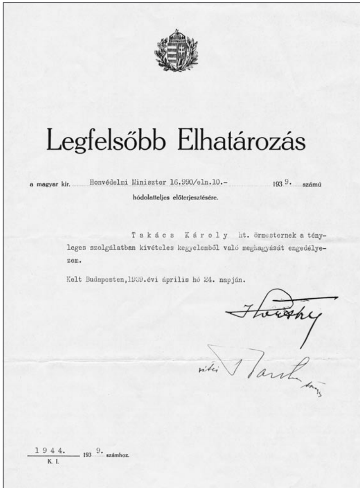
Horthy „kivételes kegyelmi” engedélye