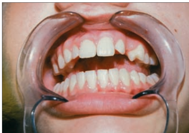
I. ábra. A retentióban maradt bal felső szemfog helyhiánya

A 17 éves leány bal felső maradó szemfog retentiója okozta foghiány miatt kereste fel szájsebészetünket. A beteg elmondta, hogy kezelése céljából több fogorvost keresett meg, akiknek hídpótlási javaslatait nem fogadta el. Esztétikai szempontokra hivatkozva a beteg kifejezett kérése volt az állcsontban maradt szemfog sorba állítása. A hiánynak megfelelően palatinalisan félbabnyi, kemény tapintatú, fájdalomtalan duzzanatot észleltünk. Az 1. ábra a bal felső szemfog helyhiányát mutatja, mely hiány elegendő helyet kínált a retentióban maradt szemfog sorba állításához. A 2. ábra a kezelés előtt készült panoráma röntgenfelvételt mutatja, melyen tengelyeltéréssel, palatinalis helyzetben, a 21, 22 fogak