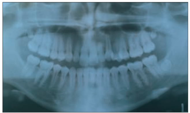
5. ábra. A sorba állított fog panoráma röntgenfelvétele

kezeléssel jó esztétikai és funkcionális eredményt sikerült elérni, melyet a beteg és a szülei egyaránt megelégedéssel fogadtak (4. ábra). Az 5. ábra a helyére került szemfog panoráma röntgenfelvételét mutatja. A rögzített fogszabályozó készülékkel történő kezelés után a retentiós, Hawley akrilátlemez viselése 2 évig tartott.