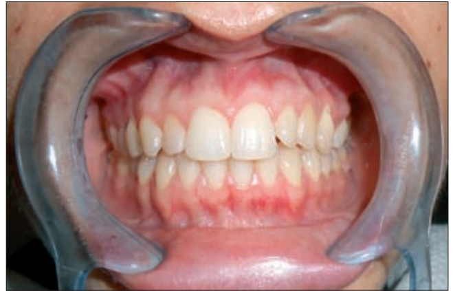
4. ábra. A helyére került 23 fog occlusióban

vözetből készült, négyzet átmérőjű előreformált ívet a 16–26 fogakra gyűrűkkel, a kisörlőkre és a frontfogakra zárrakkal rögzítettük. Majd a palatinális felszínen a 22 fog vonalában tapintott duzzanat felett, a gingíva szélétől 1 centiméterrel cranialis irányba 2 cm-es ív alakú metszésből mucoperiostealis lebenyt mobilizáltunk. Az így előtűnt csontdudoron corticalis csontablakot készítettünk, melyen keresztül látótérbe került a retineált szemfog koronai része. A fog koronai részére Smart Bond orthodontiai nedves ragasztóval gombocskát ragasztottunk, és azt drótligatúrával összeköttöttük a 23 helyhiány felett átívelő fogszabályozó készülék ívével, mely kapcsolatot a 3. ábra mutatja. A kezelés első részében a tengelyeltérés korrigálásával egy időben a fog palatinális helyzetéből buccalis irányba történő elmozdítást, az alveolaris csontozaton keresztül való átjutást, a buccalis felszínen való előtörést segítettük elő. Ez hat hónapig tartott. A buccalis erupció után következett a szemfog sorba állítása és occlusióba történő beszabályozása, mely 2 hónapot vett igénybe. A 8 hónapig tartó kombinált szájsebészeti-orthodontiai