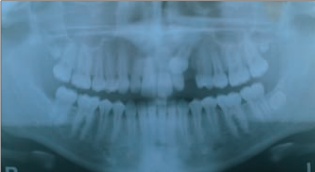
2. ábra. A 23 fog retentiója tengelyeltéréssel, palatinális helyzetben

mögött látható az előtörésben visszamaradt szemfog. A fog koronája körül éles szélű cysta volt észlelhető. A klinikai, radiológiai és orvosi laboratóriumi vizsgálatok után kombinált szájsebészeti-orthodontiai kezelési tervet készítettünk, melyet a beteg és a szülők is elfogadtak. Először a 16–26 fogakra rögzített fogszabályozó készüléket helyeztünk fel. A nikkel–titánium öt-