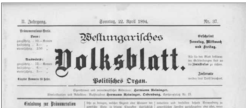
4. kép. Westungarisches Volksblatt fejléce.