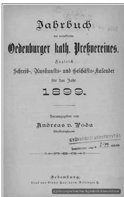
5. kép. Jahrbuch des projektirten Oedenburger katholischen Pressvereines. 1899. címlapja. (Dr. Kovács Pál Könyvtár és Közösségi Tér, Digitális Könyvtár, Győr)

miközben a betű, az írás többnyire 'írott malaszt' marad." Utolsó mondatában pedig azért, hogy mégis írásra adta a fejét, így kér bocsánatot: „ Mag mir der geduldige Leser diesen meinen 'blinden Eifer' verzeihen. ” „Kérem, bocsássa meg nekem a türelmes olvasó ezt a 'vakbuzgóságomat’” 81 Póda sajtóküzdelmé itt aztán véget is ért, mert úgy döntött, vagy sorsa hozta úgy, de ez lett a katolikus sajtó megteremtése ügyében nyomtatásban megjelent utolsó mondata.