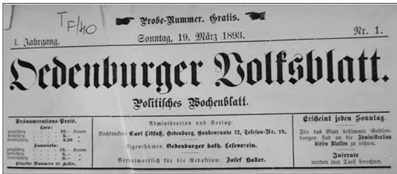
3. kép. Oedenburger Volksblatt első számának fejléce. (MNI GyMSMSL TF/40)